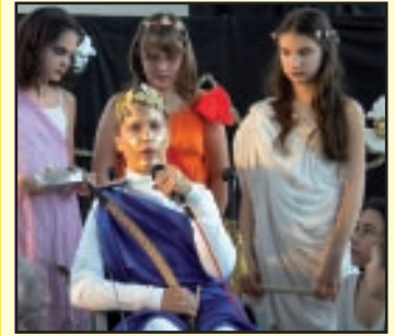
Iskolai farsang: diák, tanár jelmezben...