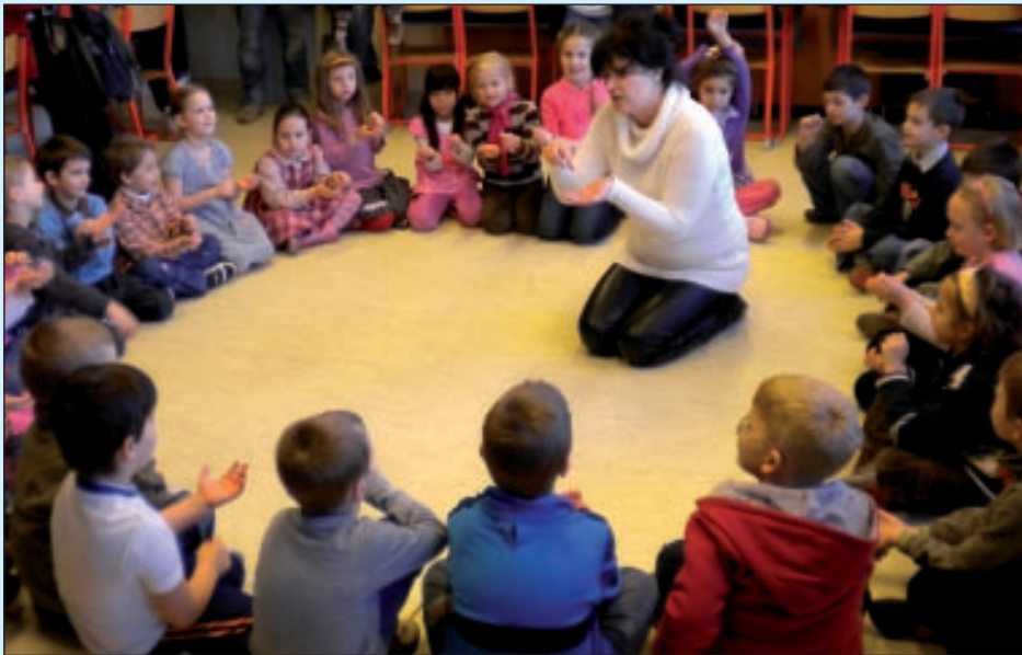
Népszerűek az iskola-előkészítő foglalkozások