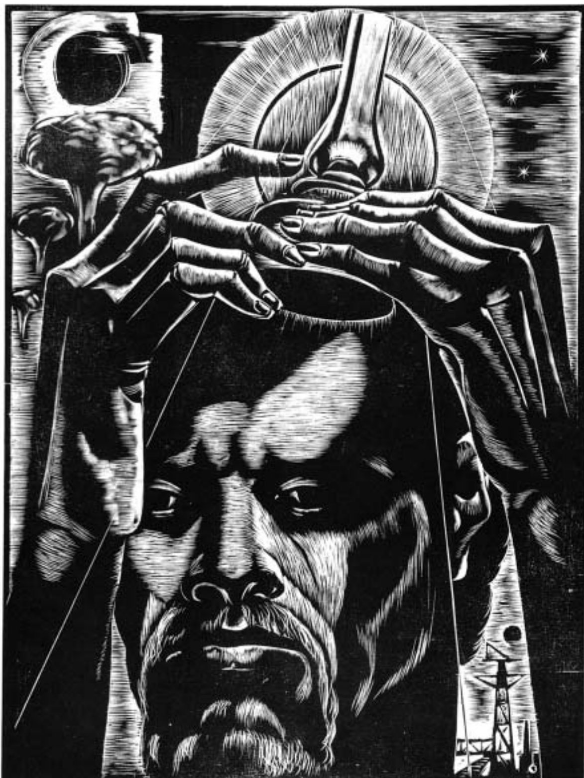
Lámpás önarckép (1963)