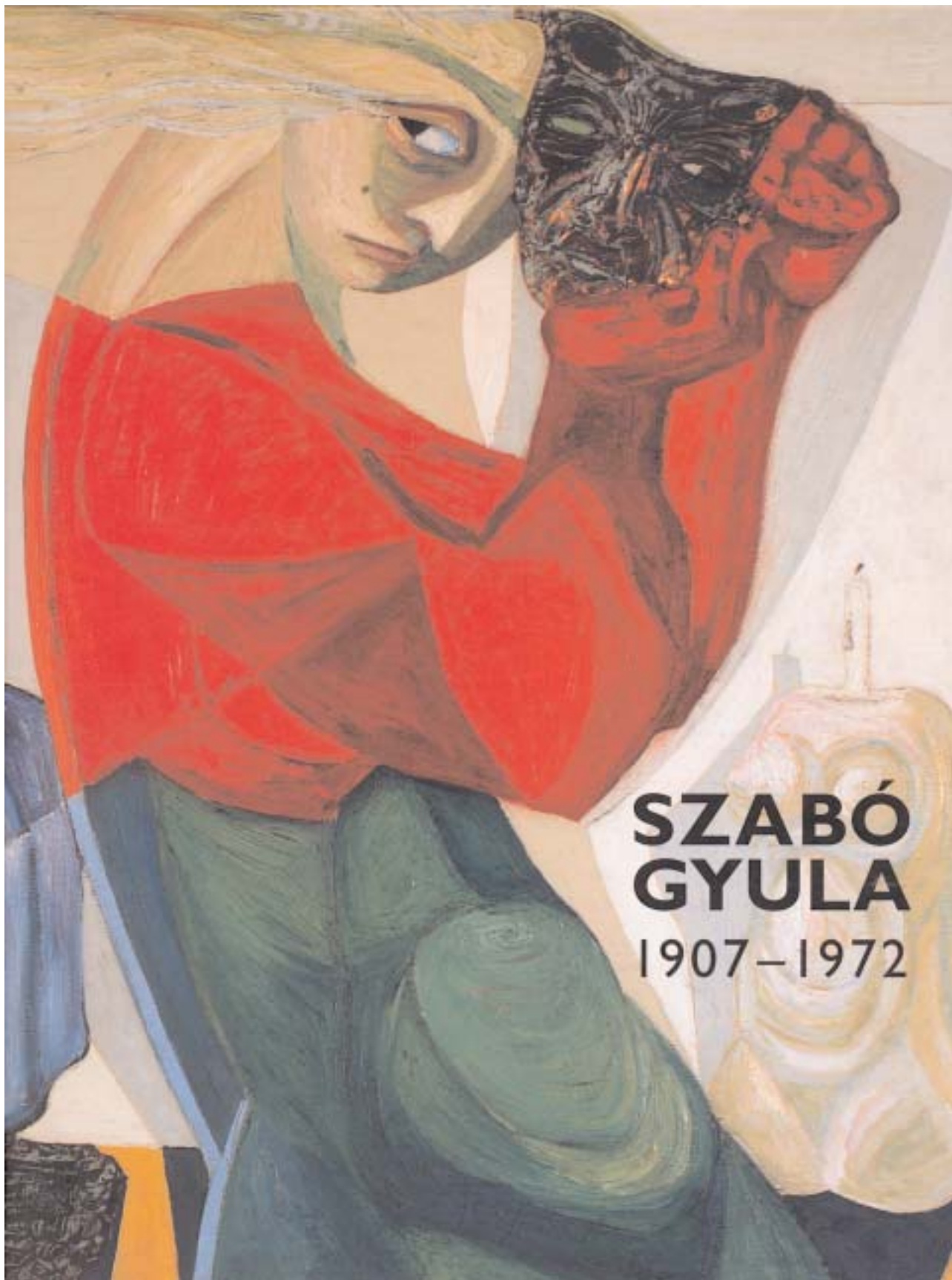
SZABÓ GYULA 1907–1972