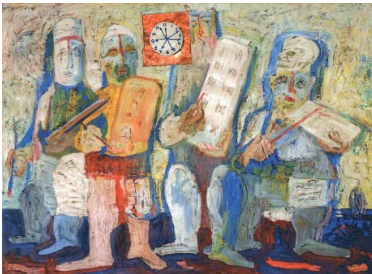
Bolond festők (1969)