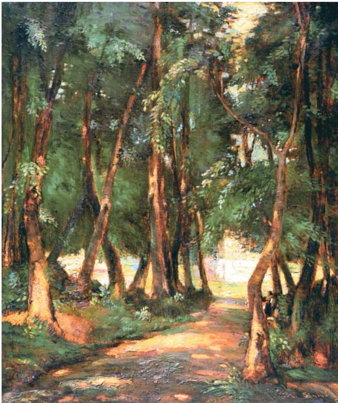
Út a losonci fürdőbe (1955)