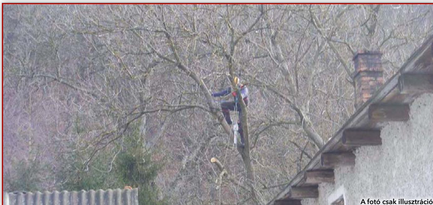
A fotó csak illusztráció