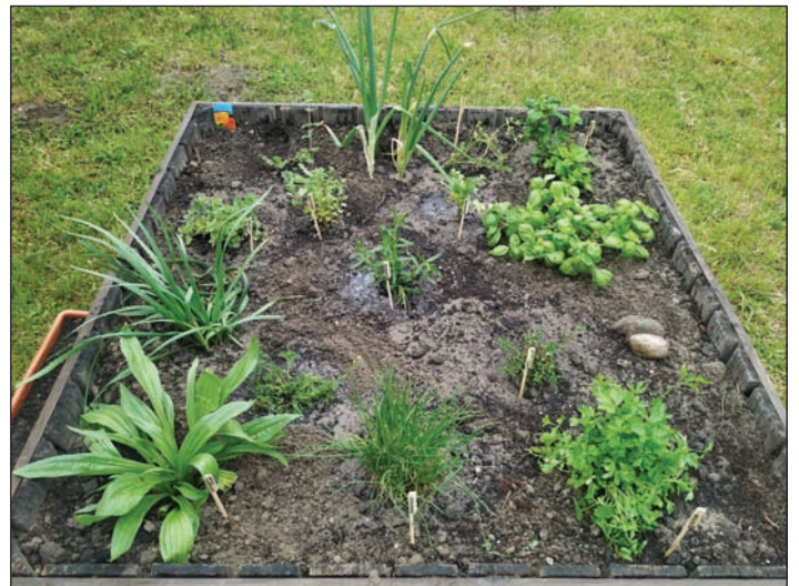
Fűszerkert a Faluházban

Április, május a virágültetés ideje. Megszépültek közttereink, középületeink is. Az önkormányzat virágai mellé az André Kertész Emlékház és a Faluház kertjébe kaptunk ajándék virágokat és jövőbeni felajánlásokat is a falu lakosaitól. A Faluház kertjében arra törekszem, hogy a régi paraszti kert virágait gyűjtsük össze, és a kiemelt ágyásba egy fűszer- és gyógynövénykertecske is kerekedett. Köszönjük a keretet, a virágokat és a virágföldet! Szívesen fogadok még palántákat, és ősszel majd évelőtoveket is! „A fűszerágyás jelképez mindent, ami az élet savát-borsát megadja, a gyógynövények segítenek szükség esetén, a virágoskert pedig örömet okoz.” Mindegyik javunkra válik.