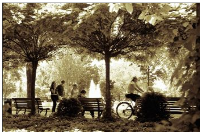
Ecsedi Ákos: Szent Imre tér