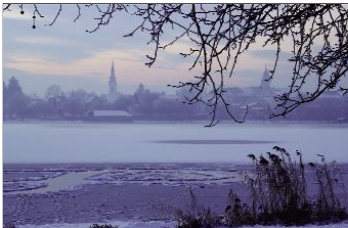
Varga Endre: Ráckeve blue