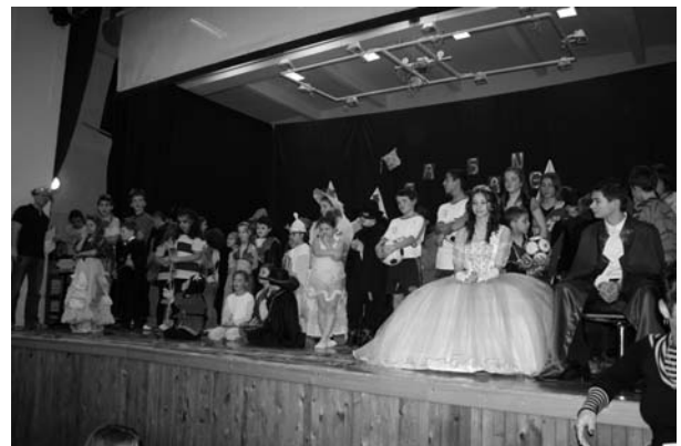
A Hercegi pár és a sok ötletes jelmezbe öltözött gyermek