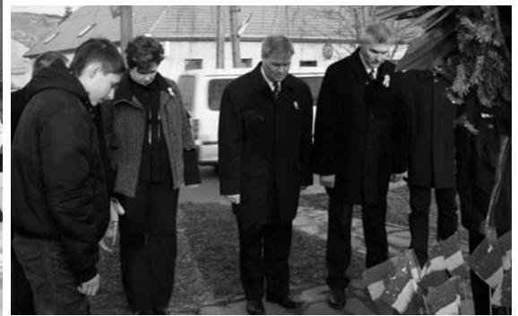
Tarcal község Önkormányzatának és intézményei- nek vezetői helyezik el az emlékezés koszorúját