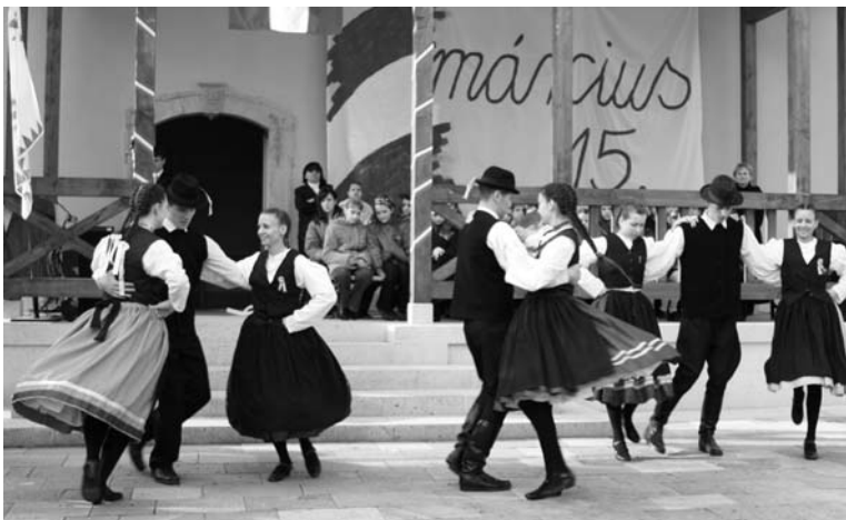
A szintén „Pro Urbe Tarcalért” díjas Tarcali Hagyományőrző Egyesület műsora