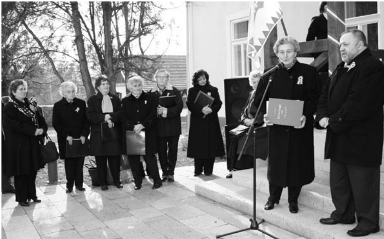
A „Pro Urbe Tarcalért” díjat veszi át az Örökifjak Asszonykórus