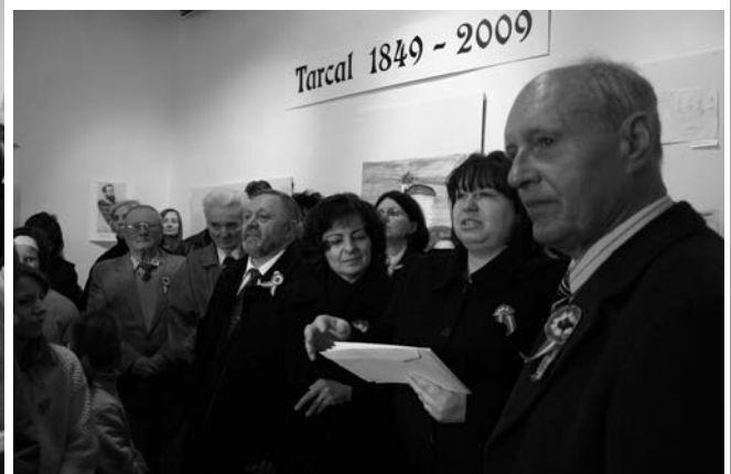
Az emléklapok átadása