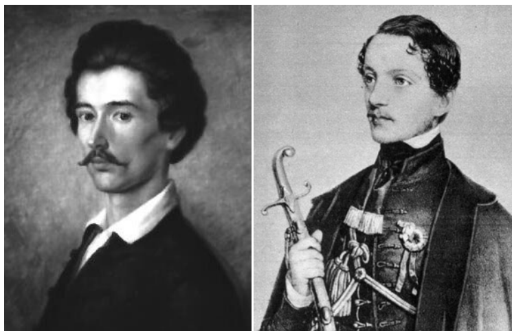
Márciusi ifjak: Petőfi Sándor és Vasvári Pál

Jánoshida Község Képviselő-testülete tisztelettel meghívja a község lakóit a március 15-én tartandó megemlékezésre.