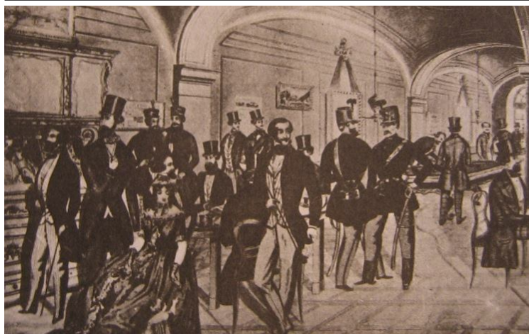
A Pivax Kávéház, a „Forradalmi Csarnok”