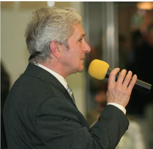
Kajos Kálmán csárdásokat énekelt