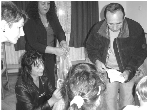
Az öröm pillanatai a végeláthatatlanul várakozó és az ajándékot megkapó gyermekarcokon

A helyi Kisebbségi Önkormányzat valamennyi gyermeket édességekkel és gyümölcsökkel teli ajándékosomaggal ajándékozott meg a nevelési év utolsó napjaiban, amit ezúton is köszönünk a Szülők és a magunk nevében.