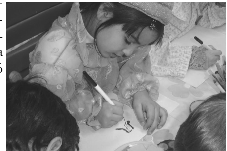
Meseillusztráció készül A só című mese alapján

Az óvodákban rendezett módszertani bemutatók sikerkritériumai voltak a technikai jártasság bemutatása, az esztétikai élmények közvetítése, a gyermeki kreativitás, fantázia tükröződése a gyermekmunkákban. A szakmai projektek a vizuális nevelés egy-egy szeletét igen változatosan mutatták be. Köszönjük a b e m u t a t ó kollégáknak!