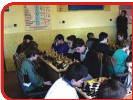
2000-ben Cseveg - sakkverseny. iskolásoknak és felnőtteknek, mely els lépése volt a sakkszakosztály létrejöttének