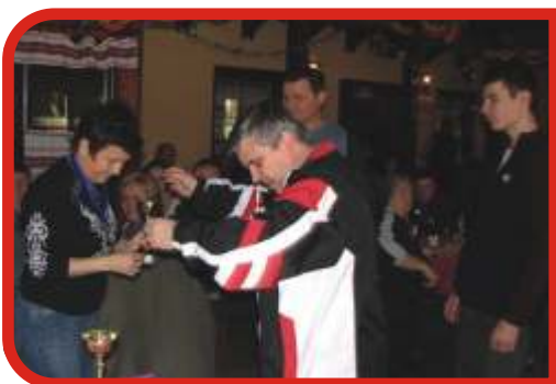
2007-ben Kozármislenyi Cseveg Bowling Kupa