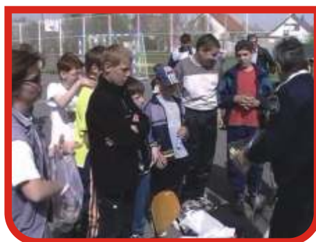
2000-ben Cseveg napot tartottunk az aktív kikapcsolódás számtalan területén.

Az amatőr tömegsport terén még asztalitenisz fesztivált és asztalitenisz bajnokságot is rendeztünk. Minden sportversenynél elsődleges szempont volt, hogy az igazi "amatőröket" versenyeztessük egymással. A sportolók csak játszanak egymás ellen, az amatőröket pedig hagyják élvezni a játék örömeit.