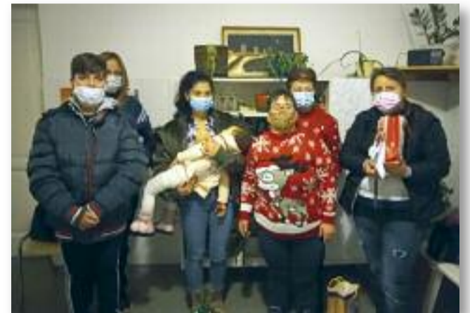
Családonként 41.708.- Ft-ot sikerült átadni

Az adventi csoda átalatok jött létre. Idén is lesz alkalom, hogy együtt segítsünk másoknak.