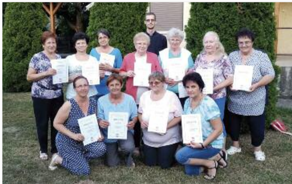
A karitászcsoport tagjainak egy része az oklevélatadás után

Mindenkinek békés, boldog egészségben gazdag új évet kívánok.