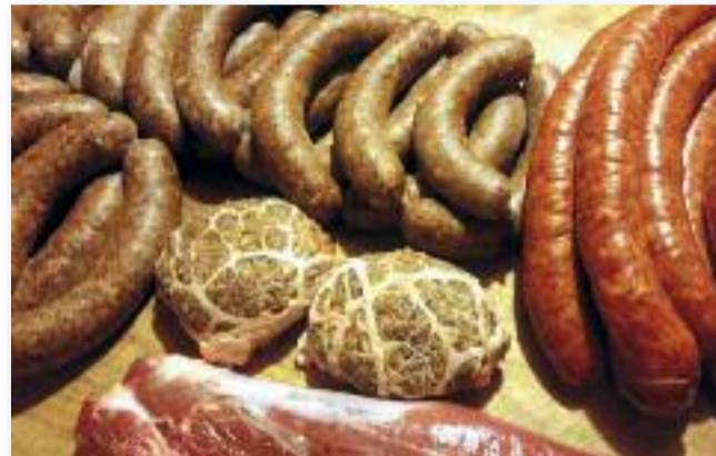
Egy egész éves húsmennyiséget raktároztak el

A tűz meggyújtása előtt még bementek egy újabb pohár pálinkára. Ezt a leleményes, közeli szomszéd kihasználta, a disznót félrehúzta és helyette a fából készült taligát szalmázta be. A társaság pálinkázás után kiment és meggyújtotta a szalmakupacot. Égés közben jöttek rá, hogy a taligát perzselik.”