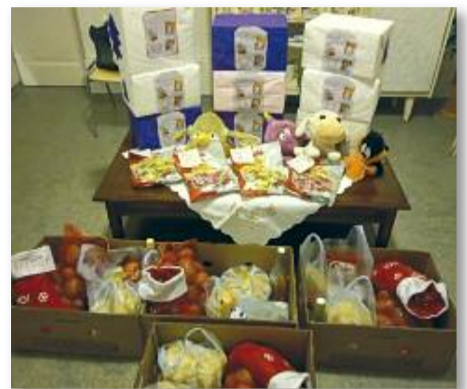
Az elkészült csomagok