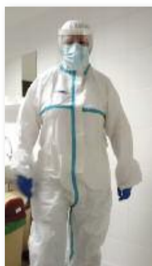
Az idősek védelme a legfontosabb

Innentől a többi lakó mozgása is korlátozott volt, mert csak irányítottan, érintkezés nélkül mozoghattak az udvar és a szobájuk között. Az étkezőt sem használhatták, mindenki a szobájában kapta és fogyasztotta el az ételt. Bevezetésre került a dolgozók 24-48-as munkarendje. A karanténban lévő idősök ellátását csak az ún. "covidos" nővér végezhetette. Az ő öltözéke covidos szobánként: munkaruha + új védőoverall + FFP3 szájmaszk + arcpajzs + gumikesztyű + lábvédő. Ebben az öltözékben (amibe naponta többször öltözött) ő volt a nővér, a takarítónő, a mosónő, a foglalkoztató, az étkeztető. A december 8-i teszt ered-