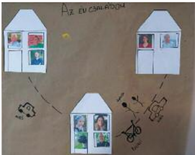
Ismertessük meg családjunkat!

A cikksorozat utolsó részeként a kozmikus nevelésről fogok néhány gondolatot írni. Ebbe a témakörbe tartozik minden, ami a világunkban körülvesz: emberek, állatok, növények, művészetek, történelem stb.