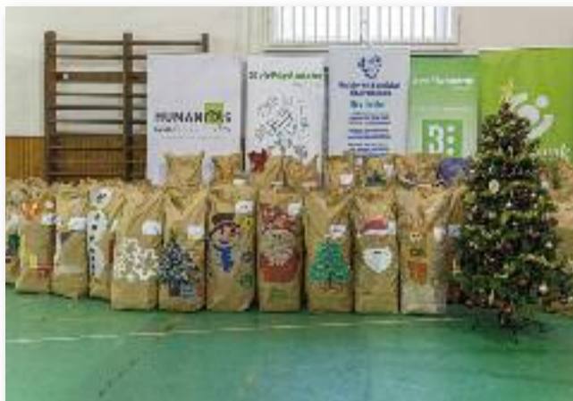
56 család karácsonyát tették szebbé 2020-ban

Az OTP Fáy András Alapítvány, a Humanitas Szociális Alapítvány és a Budai Középiskola dolgozói és tanulói által gyűjtött adományok (tartós élelmiszer, illetve játékok) jászárokszállási kiosztásába kapcsolódott be a koordinálást segítve a Deák Ferenc Gimnázium, Közgazdasági és Informatikai Szakgimnázium.