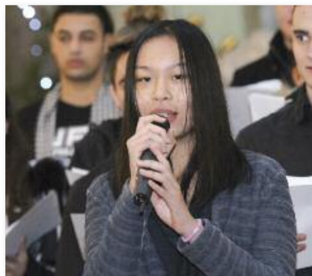
Neay a karácsonyi koncerten

- Egyértelműen igen. Még Thaiföldön sok célt tűztem ki magam elé, de ideérkezvén e célok kicsit módosulnak. Például úgy gondoltam, 3 hónap alatt megtanulok magyarul, de azóta rájöttem, ez nem megy ilyen gyorsan. Igazság szerint sokkal nehezebb, mint otthon képzeltem. Azt hittem, barátokat szerezni is könnyebb lesz. Sok helyzet nem úgy alakul, ahogy terveztem, mert félénk vagyok. Azonban jól érzem itt magam, s úgy gondolom, megvalósulnak majd a céljaim.