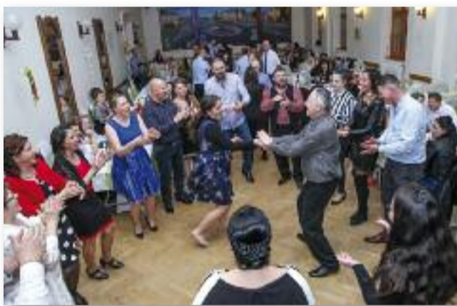
Igazán jó volt a hangulat

bolatárgyakkal, önkéntes munkájukkal támogatták a rendezvényt.