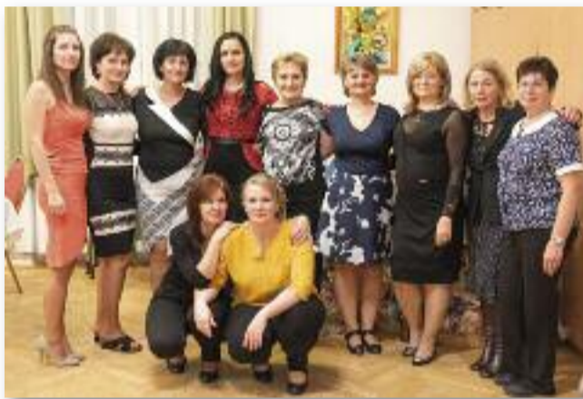
Az óvoda dolgozói

A rendezvény sikere a közösségünk együttes munkájában rejlik. Úgy gondolom a legnagyobb emberi értékek egyike az önzetlen adakozás tudása. Köszönjük, hogy az óvodás gyermekekért ilyen sokan megteszik ezt 10 éven át.