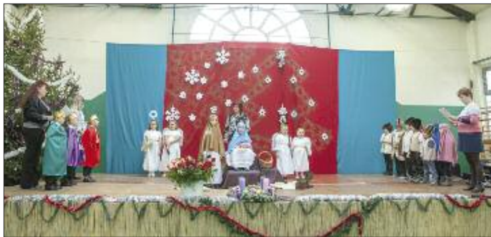
Jelenet az óvodások műsorából