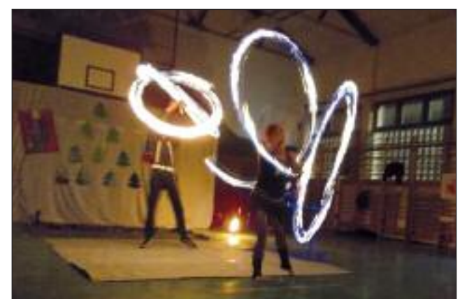
A tűzvarázslók elkápráztatták a közönséget

vész, aggódtunk a testi épségükért, de a tökéletes dobások, kapások, biztos mozdulatok bebizonyították, ők nem hibáznak. Az előadás végén a gyerekek kipróbálhatták, hogyan lehet elfújni a lángot, mely nem bizonyult könnyű feladatnak.