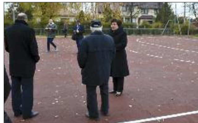
A kézilabdapálya gumiborítást kapott