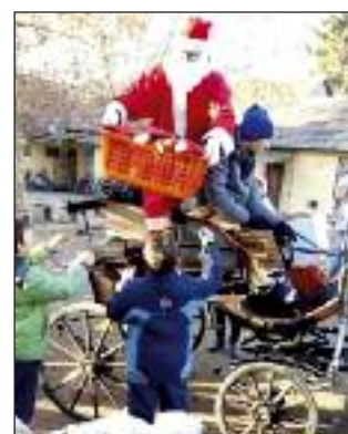
A Mikulás átadja az ajándékot a gyerekeknek

A 7 mérföldes csizmában heted 7 határon át mesevetélkedőbe 17 csapat nevezett be