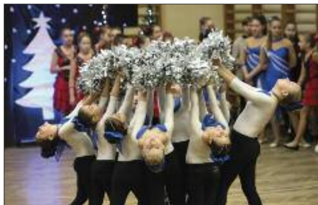
Egy csodálatos koreográfia

fejtartásra, a botok pontos átadására is figyelték. Tapsvihar aratott a legnagyobbak produkciója, hiszen náluk a sokéves közös munka, az összszeszokottság látszott minden