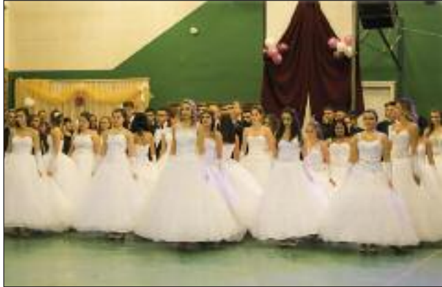
A 12. A-s lányok keringőt táncolnak