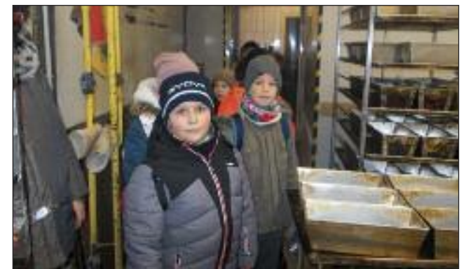
A 3. osztály ismerkedett a pékek munkájával

De jó volna, mindent, Elfeledni, Szeretben üdvözülni, De jó volna ünnepelni, De jó volna megnyugodni. December 19-én iskolánk