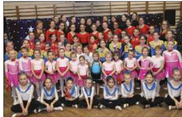
A Csillag Mazsorett táncosai és tanárai

hol a fej fölött, máskor a térd alatt, olykor a háton forgott. Volt, mikor egy, máskor két bottal is végezték a mozdula-