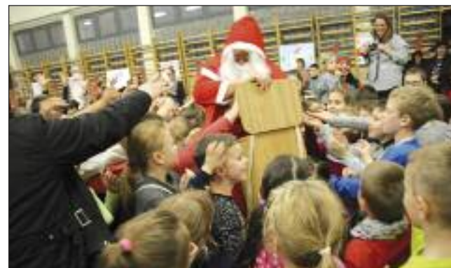
A Mikulás megajándékozza az előadás nézőit

Aki pedig jól várakozik, az időből épp azt váltja meg, ami a legképzesebb és legelviselhetetlenebb: a hetek, órák percek kattogó, szenttelen vonulását. Aki valóban tud várni, abban megszületik az a mélyes türelem, amely szépségében és jelentésében semmivel se kevesebb annál, amire vár.” /Pilinszky János/