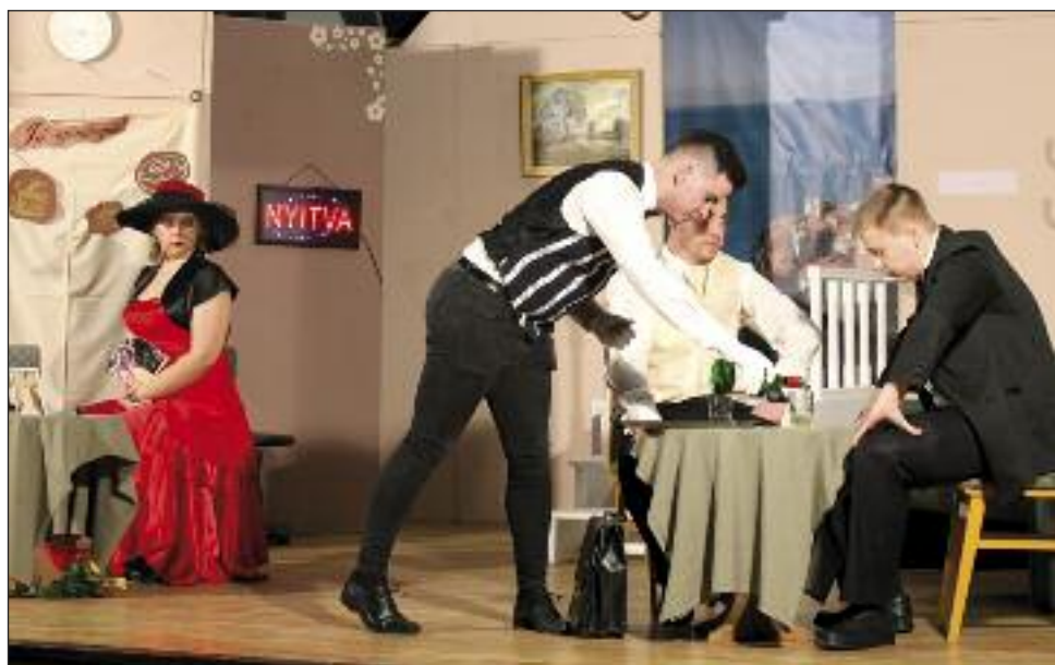
A vörös bestia áldozatra vár

nem tartja magát igazán boldognak, Félix nagy boldogságról számol be: biztos állása van, fontos üzle-