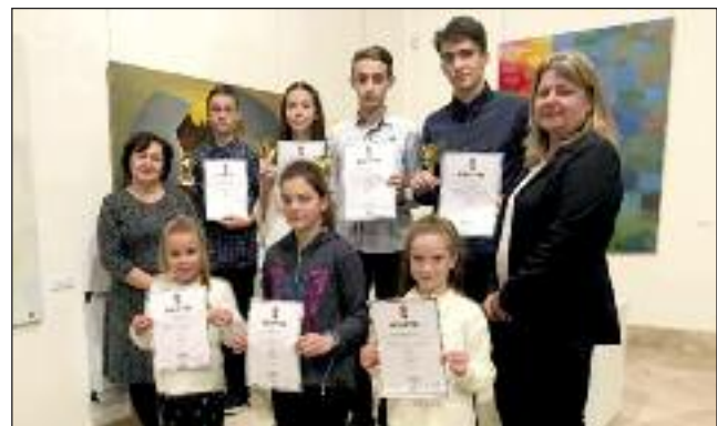
Bolyai Anyanyelvi verseny győztesei és felkészítőik

csor Edina tanárnő segítette. Tudjuk, hogy egy-egy versenyre nagyon sokat kell készülni, gyakorolni, feladatokat megoldani. Amikor az eredményhirdetésen átvehetik tanítványaink és felkészítőik az elismerő oklevelet, az mindenki számára maradandó élményt nyújt. Gratulálunk a csapatok tagjainak és a felkészítésüket segítőknak a szép sikerhez.