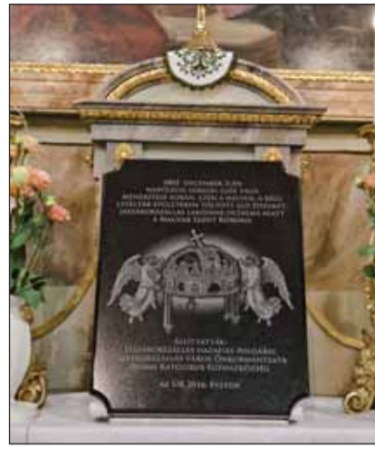
Emléktábla a Jászárokszálláson egy napig őrzött Szent Koronáról