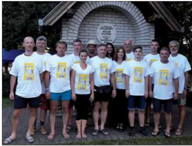
Odakerékpározók a jász emlékműnél