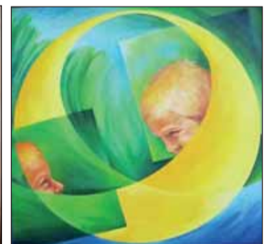
Mihalik Judit festménye