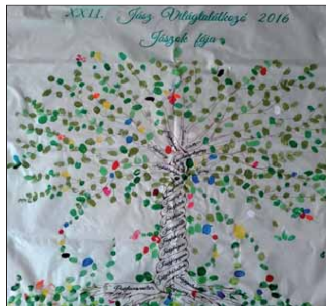
Jászok fája - ujjlenyomatok