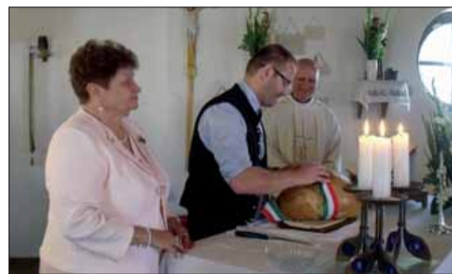
Új kenyér felvágása

ték kezdetüket a színpadi programok. Az Önkormányzat által alapított „Jászágóért” díjat idén Bordás Gáborné és