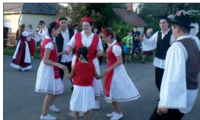
Csószlányok és legények tánca

mutakozott be településünkön a Jászági Népi Együttes legkisebb csoportja a Borbolya, amelyben jászágói gyermekek is táncolnak. Ezután a néptáncot felváltotta a modern stílusú táncelőadás, melyet egy nagyon szórakoztató operett gálakonzert követett. A rendezvény ideje alatt rendőrségi veteránautókat és fegyvereket tekinthettek meg az érdeklődők. A főzőverseny eredményhirdetését követően a színpadi programot a Defekt Duó poénos műsora zárta. Majd 17 órakor szokásos útvonalán elindult a kisbíró által vezetett szüreti felvonulás, melyet a díszgyengyruhás Hagyományörző Rendőrszázad is színesített. A napot a hajnalig tartó fergete-