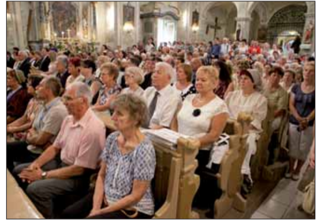
A szentmisére kilátogató hívők