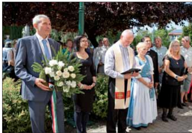
Szent Korona emléktáblánál

polgármesterünk és jászkapitányunk szegett meg és amelyből minden jelenlévő kapott egy szeletet, hiszen a kenyér nemcsak az egyik legfontosabb táplálékforrásunk, hanem az élet szimbó-