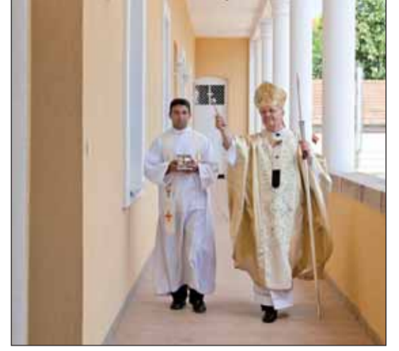
Érsek atya megáldja a felújított plébániát