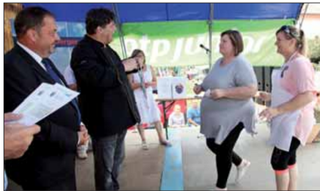
Egyéb kategória fődíj Töltikék

A polgármester felvetette azt is - a világtalálkozó sikerére is gondolva -, el kellene