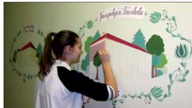
Készül az emlékfal