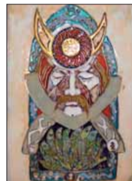
Ördög Margit tűzzománc képe