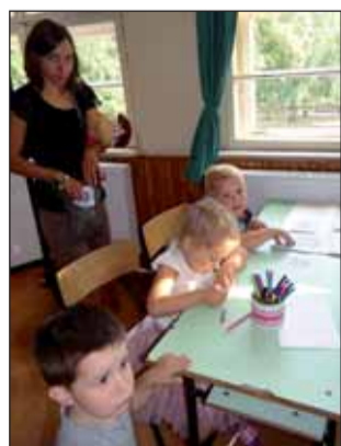
A kicsik színezhettek