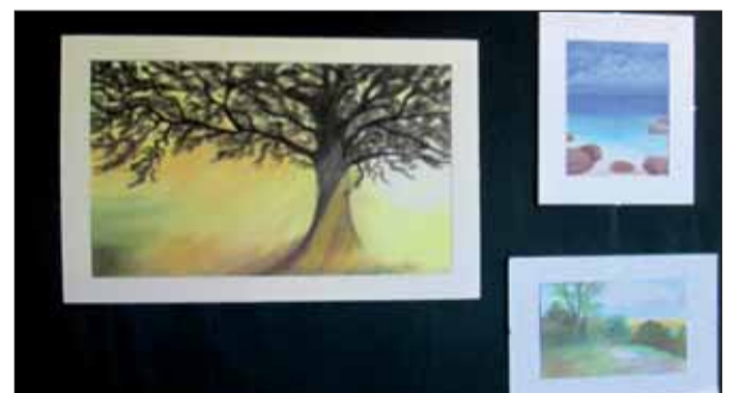
Kaszab Lajosné pasztell képei