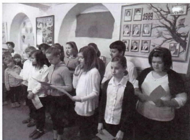
Október 6-án a hatodik osztályos tanulók műsorával emlé- keztünk meg az aradi vértanúkról.