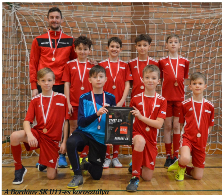
A BORDÁNY SK U11-es korosztálya

Jöjjenek el a mérkőzésekre és biztassák kedvenceiket! Hajrá Bordány! Hajrá BSK!!!