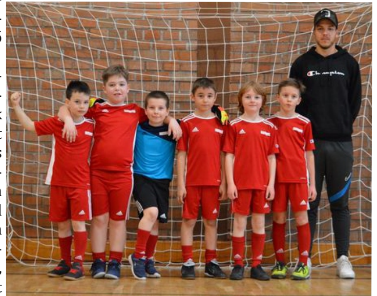
A BORDÁNY SK U9-es korosztálya

Január 22-én, szombaton az U7-es korosztály küzdelmeivel vette kezdetét két év szünet után a bordányi Start Kupa. Az egyesületek, játékosok és edzők által is várt első korosztályos eseményre öt klub nevezett, az eseményt körmérkőzéses formában bonyolították le. Csapatunk az ötödik helyet szerezte meg, a legkisebbek részére szervezett programot a Tápé Főnix gyerekcsapata nyerte. Két hét szünetet követően az U11-es korosztályé volt a főszerep. Itt nyolc csapat lépett parkettre. Két négyes csoportban vívtak éles meccseket az utánpótlás gárdák, ezt követően pedig helyosztókon döntöttek el a végső helyek sorsát. Izgalmas, kiélezett találkozót láthattak a nézők, két mérkőzés is csak büntetővel dőlt el. Csoportban egy mérkőzésen hibáztunk, így a BSK U11-es csapata az ötödik helyért meccselhetett, ahol meggyőző fölényrel, öt góllal vertük a Móravárost. Ezt a tornát a Makó FC nyerte, aki a döntőben egy góllal bizonyult jobbnak a SZEOL SC csapatánál. Február 19-én, szombaton tizenegy U9-es egyesület vendégszerepelt Bordányban, többek között Gyuláról és Kecskemétről is fogadtunk csapatokat. Két négyes csoport és egy hármas