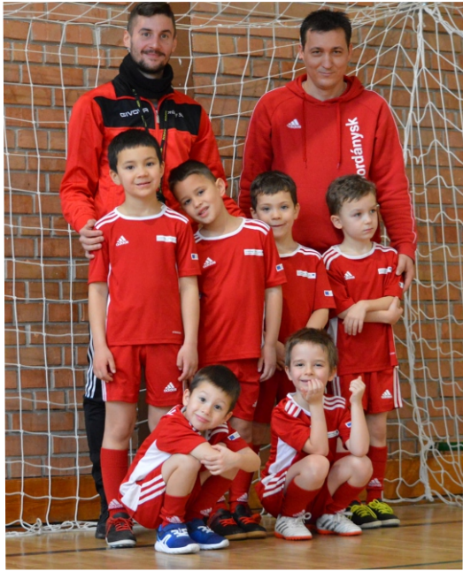
A BORDÁNY SK U7-es korosztálya

Január 22-én, szombaton az U7-es korosztály küzdelmeivel vette kezdetét két év szünet után a bordányi Start Kupa. Az egyesületek, játékosok és edzők által is várt első korosztályos eseményre öt klub nevezett, az eseményt körmérkőzéses formában bonyolították le. Csapatunk az ötödik helyet szerezte meg, a legkisebbek részére szervezett programot a Tápé Főnix gyerekcsapata nyerte. Két hét szünetet követően az U11-es korosztályé volt a főszerep. Itt nyolc csapat lépett parkettre. Két négyes csoportban vívtak éles meccseket az utánpótlás gárdák, ezt követően pedig helyosztókon döntöttek el a végső helyek sorsát. Izgalmas, kiélezett találkozót láthattak a nézők, két mérkőzés is csak büntetővel dőlt el. Csoportban egy mérkőzésen hibáztunk, így a BSK U11-es csapata az ötödik helyért meccselhetett, ahol meggyőző fölényrel, öt góllal vertük a Móravárost. Ezt a tornát a Makó FC nyerte, aki a döntőben egy góllal bizonyult jobbnak a SZEOL SC csapatánál. Február 19-én, szombaton tizenegy U9-es egyesület vendégszerepelt Bordányban, többek között Gyuláról és Kecskemétről is fogadtunk csapatokat. Két négyes csoport és egy hármas