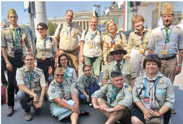
A Ricinus órs.

A kongresszus középpontja az Eucharisztia volt, ami többeknek a katolikus valláshoz kapcsolódik. De az egész heti program magába foglalt egy ökumenikus, nemzetközi hangulatot. A katolikus ernyő alatt minden kereszténynek volt helye. A kezdő szentmisén Taizé ének hívta az embereket és a Szent Lelket közénk. A több mint 1,200 első áldozó közt volt gyermekek, fiatal felnőt és egy pár öreg is. Magabiztosan választottak amint a keresztiséget saját nevükben vállalták. A szentmisén a cserkészek zászlókkal kísérték az áldoztató papokat és egy pár száz üveg vizet is adtak át a melegben szenvedőknek. Egy első áldozás nagy esemény, de mégis a cserkészek voltak a szemem előtt. Sültek az égő nap alatt, énekeltek mind az angyalok és mikor visszajöttek az áldozástól, rájuk volt festve Jézus jelenléte bennük. Erőteljesen csatlakoztak a több-ezer emberhez amint a Kongresszus hivatalos himnuszát énekeltek. Ma még talán korszerűbb mint 1938-ban. A filmbemászó dallam refrénje könyörgés és felszólításként szállt Krisztushoz, hogy "forrassz egyé békességben minden népet s nemzetet! Így felfegyverezve lelki energiával gyülekeztünk minden reggel 8 kor és vártuk beosztásainkat.