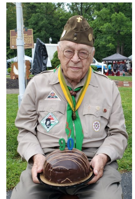
Cserkésznap 2021. - a 90. születésnapja.