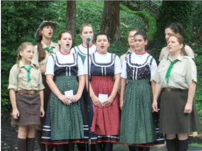
2013. július 20-án cserkész regösök népdal és tánc előadással szerepeltek a clevelandi Magyar Kultúrkert 75-ik évforduló és a „Heritage Wall” felavatási ünnepélyén. .

A clevelandi Magyar cserkészek díszőrséget álltak 2013. május 18-án a Mindszenty Plázán Cleveland belvárosában, amikor dr. Hende Csaba, Magyarország honvédelmi minisztere clevelandi látogatása alkalmából koszorút helyezett a Mindszenty József bíboros szobor előtt és az 1956 szabadságharc emlék szobornál.