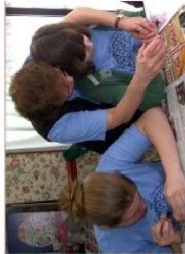
Dyeing traditional Easter eggs...

In the United States, Hungarian Scout troops first organized in 1951, in Cleveland. Since then, hundreds of Hungarian youth have taken the Scout Oath and become members of the worldwide Hungarian Scout Association in Exteris. Never forgetting our homeland's culture, but instead yearning to preserve its thousand-year-old, rich history, we work ceaselessly to keep our culture alive and pass it on to future generations. Today, Cleveland boasts nearly 250 active registered Scouts in four troops, supported by the American Hungarian Friends of Scouting, a 501(c)(3) organization.