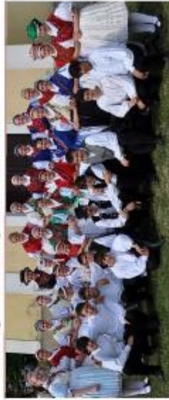
The Ensemble on tour in Kazár, northern Hungary, in July 2011

display their hard-won knowledge and feature their dancing skills, woodcarvings, paintings, and bright embroidery. These vibrant and memorable performances take place in all areas of the community, including theaters, community festivals, churches, theme parks, formal balls, nursing homes and private residences.