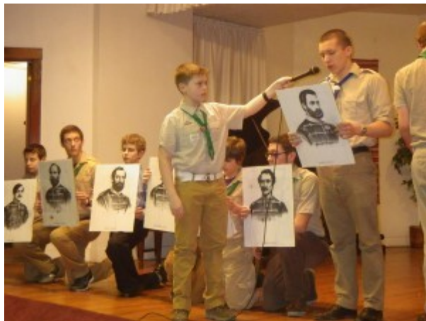
Cserkészek előadnak március 17-én az 1848-as Szabadságharc Emlék Ünnepélyen a Szent Imre templom dísztermében .