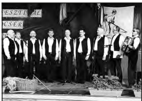
Az udvardi férfi dalárda a katonahagyományokat őrizve adott elő két dalsokrot nagy sikerrel.