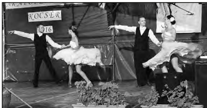
Sokan a januárban már Kocséron is bemutatkozott Pesti Zenés Színpad műsora, akik a korábbi fellépéshez hasonlóan most is fantasztikus hangulatot teremtettek zene-táncos operett összeállításukkal.

mert sláger mellett új dalokat is előadott a közönség nagy örömeire.