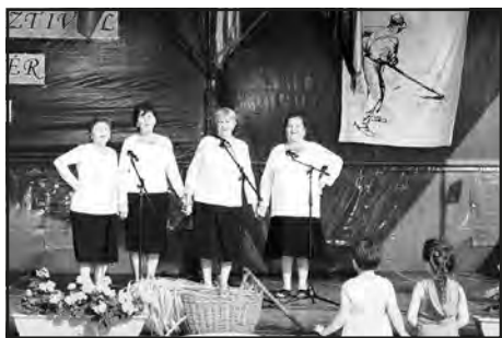
Az udvardi nyugdíjasklub dalsokrot adott elő.

Este hatra láthatóan egyre többen gyűltek össze a nézőtéren.