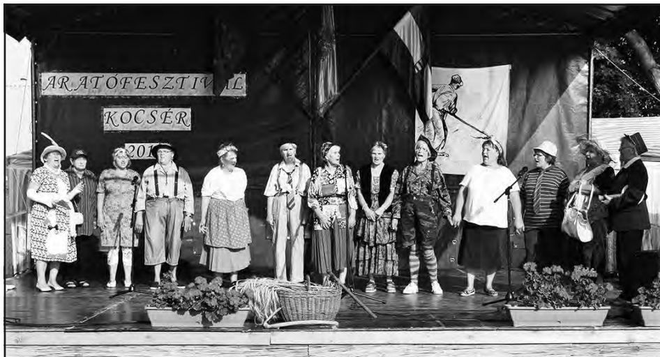
A Kocséri Népkör ezúttal nem népdalokkal szórakoztatta a megjelenteket, hanem egy mókás jelenettel készültek erre az alkalomra.