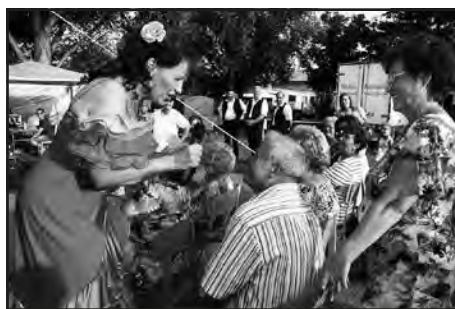
A rendkívül magas színvonalú, a közönséget is bevonó műsorukkal igazán kivételes élményt nyújtottak! Reméljük, hogy láthatjuk őket még Kocséron.