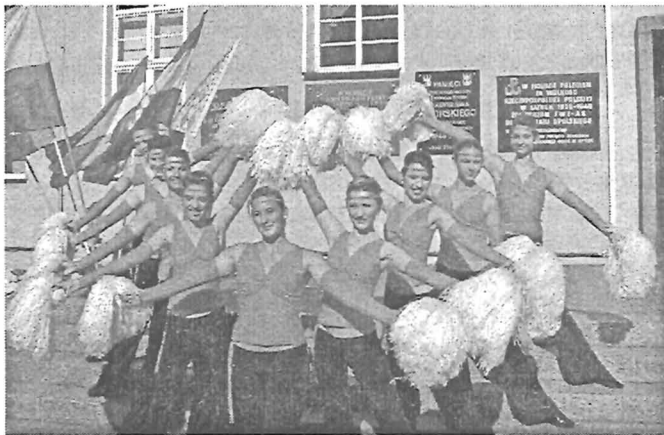
A lányok pom-pommal

A majorette-tánc történetében az eddigi legmeghatározóbb esemény az Európa Bajnokságra való kijutás, versenyzés. Hat ország: Csehország, Szlovákia, Horvátország, Lengyelország, Beloruszlia és Magyarország, közel 100 majorette csoportja versenyzett különböző kategóriákban és korosztályokban.