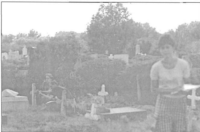
Felmérés a temetőben