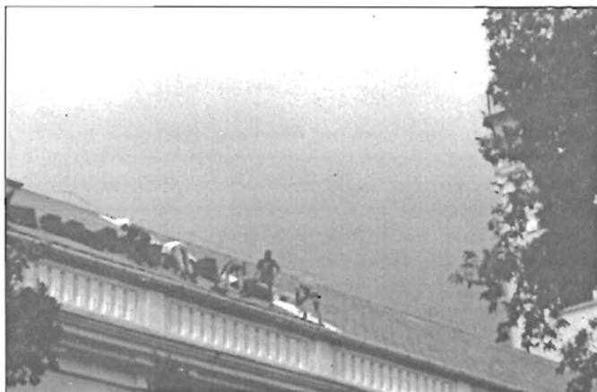
Munkások a tetőn