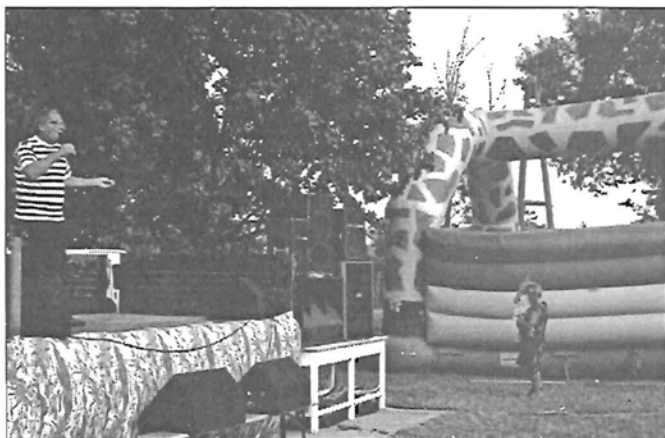
A „Besenyszegi” gyermeknapon Cibere műsora