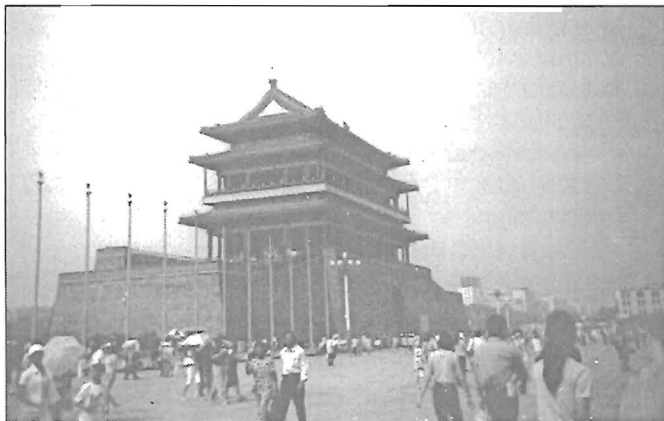
Tiltott város – Peking

Az évnyitó szeptember 5-én a Katona József Művelődési Központban lesz, a pótfelvételi pedig a zeneiskolában, a Kisréti utcában 3-án és 4-én, 16 órától.