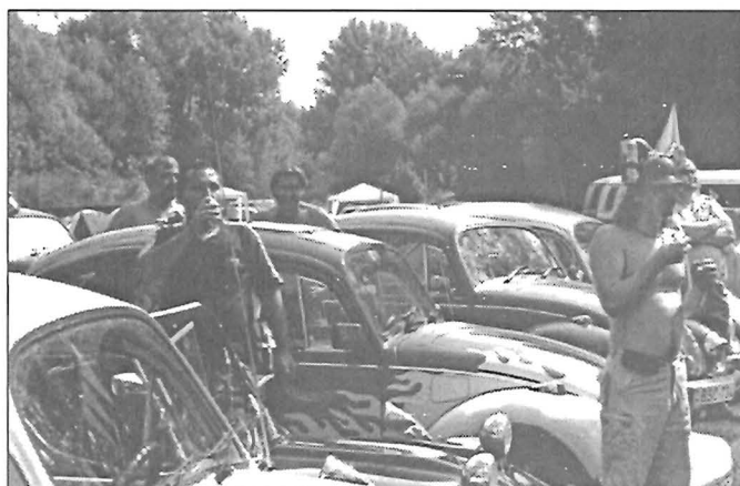
Bogarak és csudabogarak