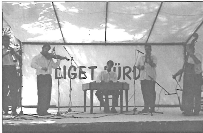
A suttymba zenekar