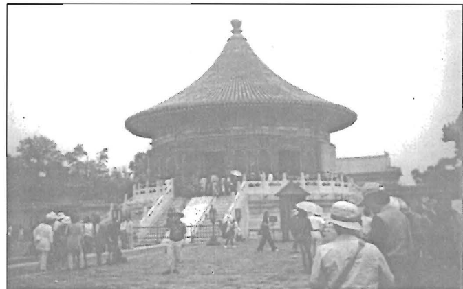
A császár téli palotája – Peking