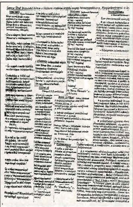
A kézirat egy részlete