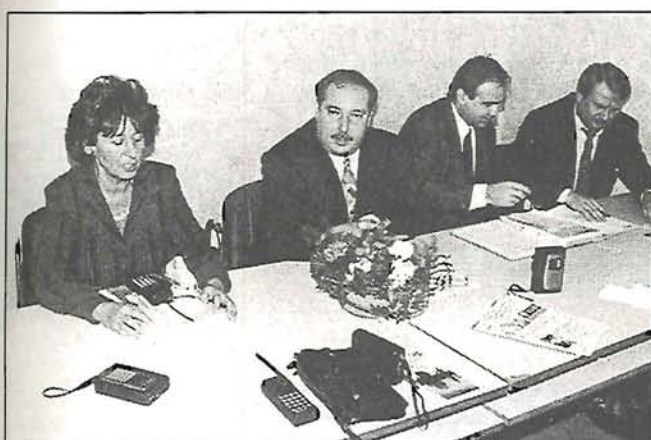
A munkaügyi miniszter látogatása