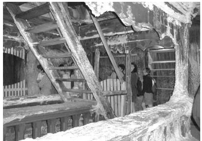
A tordai sóbánya