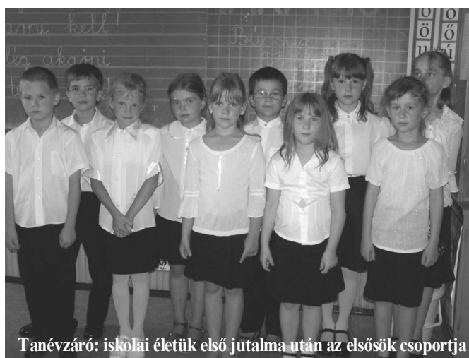
Tanérváró: iskolai életük első jutalma után az elsősök csoportja