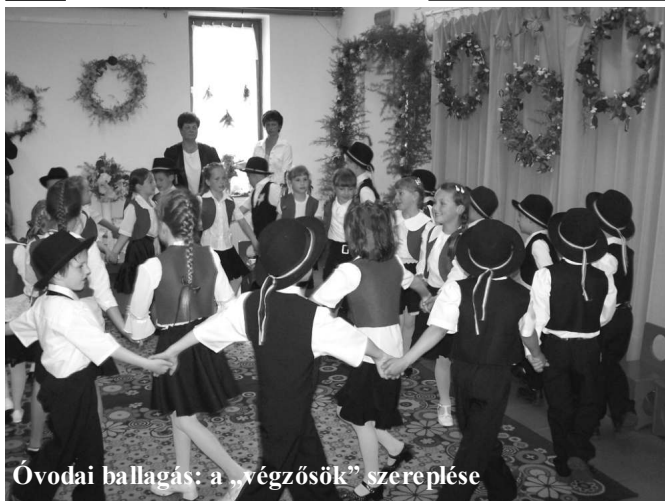
Óvodai ballagás: a „végzősök” szereplése