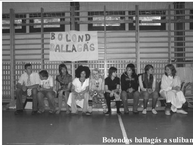
Bolondos ballagás a suliban