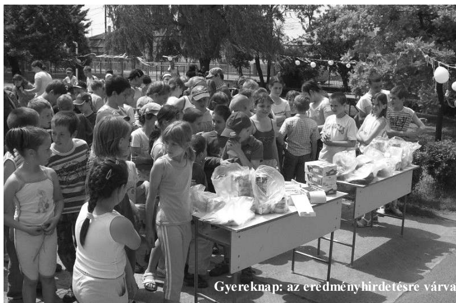
Gyereknap: az eredményhirdetésre várva