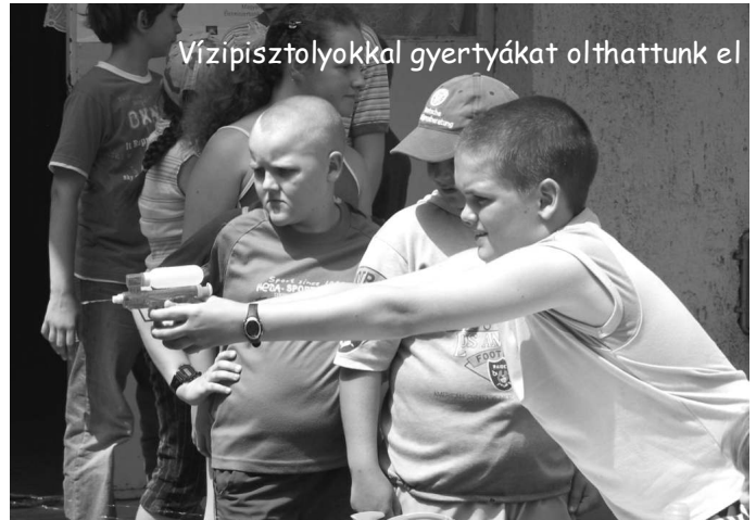
Vízipisztolyokkal gyertyákat olthattunk el