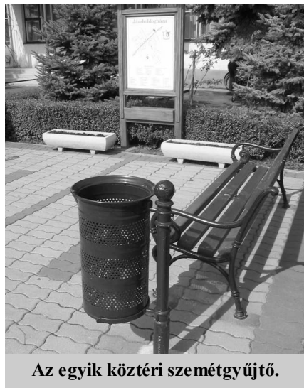
Az egyik köztéri szeméthyűjtő.

gondozását a program végéig, 2008. július 30-ig látja el.