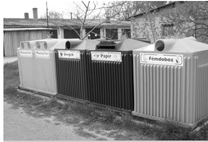
Négyfrakciós szelektív gyűjtő.

Legfőbb feladatát az illegális hulladéklerakó helyek felszámolását és a település közterületén lévő parkok