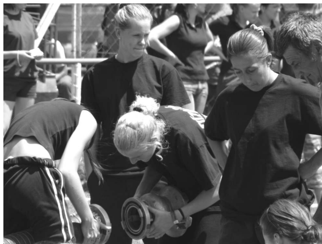
Munkában a tűzoltó „lányok”