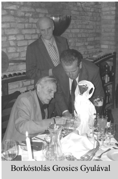
Borkóstolás Grosics Gyulával

Az első – számomra felejthetetlen élmény -, ami dr. Konkoly Mihály nevéhez fűződik, 1973-ban történt. Országos pártfeladat volt a kistelepülések összehívása. Jászboldogházának is dönteni kellett: megtartja önállóságát, vagy egyesül a szomszédos Jánoshidával. Misi bácsi, mint képviselő, nagyon határozott, szívhez szóló érvekkel győzött meg bennünket, hogy az eddigi eredmények alapján maradjunk az önállóság mellett. Az Ő kezdeményezése alapján – bár ez nem felelt meg a „felső” elvárásoknak – folytathatta községünk az 1946-ban önállóan elkezdett építőmunkát.