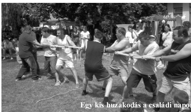
Egy kis huzakodás a családi napon