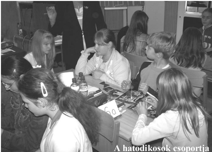
A hatodikosok csoportja

a versenyzők a legötletesebb dolgokat hozták el minden mennyiségben.