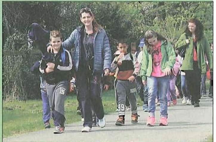
A felsős szavalók