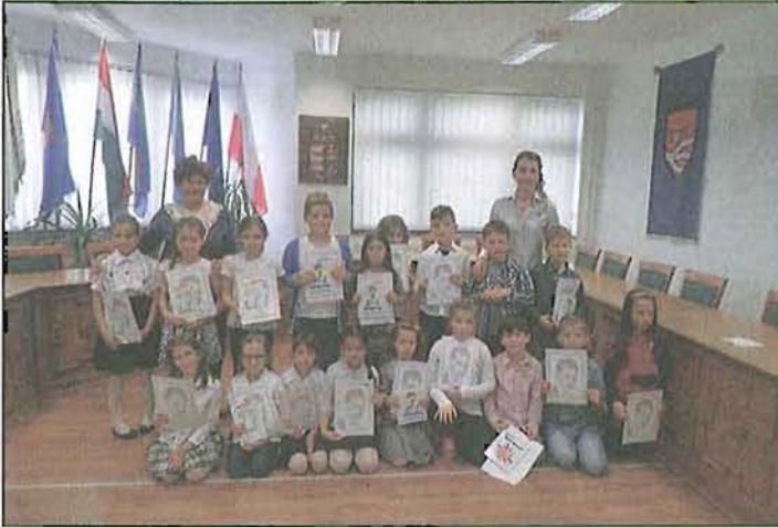
Az alsós szavalók

A Hátár Győző Városi Könyvtár által megrendezésre kerülő KÖLTÉSZET NAPI SZAVALÓVERSENYEN iskolánkból szép számmal vettek részt tanulóink.