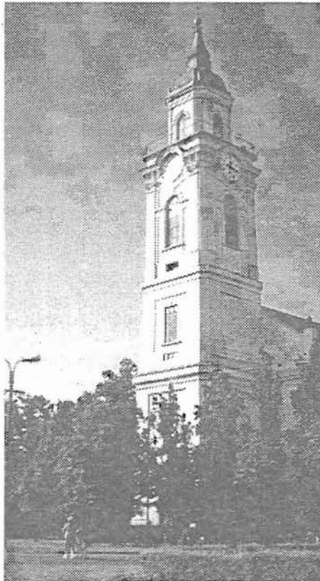
a gyomai református templom

Luther Márton a "Szeníírás doktora" és fáradhatatlan kutatója felismerte, hogy a hit dolgaiban kell eligazítania a keresztyén embereket. Ezért ajándékozta meg őket elébe csak az újszövetség, majd a teljes Biblia német nyelvre fordításával. Mint előszavában írta: az evangélium...jó hirdetés, amit énekelünk, elmondunk, és aminek örülünk - vagyis nem kemény parancs. Istennek ez az evangéliuma és Új Testamentuma tehát hír és üzenet, amelyet az egész világba elvisznek az apostolok az igazi Dávidról (Krisztusról), aki harcolt a bűnnel, halállal és ördöggel. Legyőzte azokat, és így minden érdemünk nélküli megváltotta, megigazította, élővé és boldoggá tette, és Istenhez újra elvezette mindazokat, akik a bűn, a halál és az ördög rabságában éltek, akik most arról zengedeznek, Istent dicsőítik. Neki adnak hálát és örök boldogságban élnek; ha állhatatosan hiszik ezt, és szilárdan megállnak ebben a hitben. Hiszen a bűn, a halál, és pokol rabságában sínylődő szegény ember nem kaphat nagyobb vigasztalást a Krisztusról szóló drága és kedves üzenetnél."