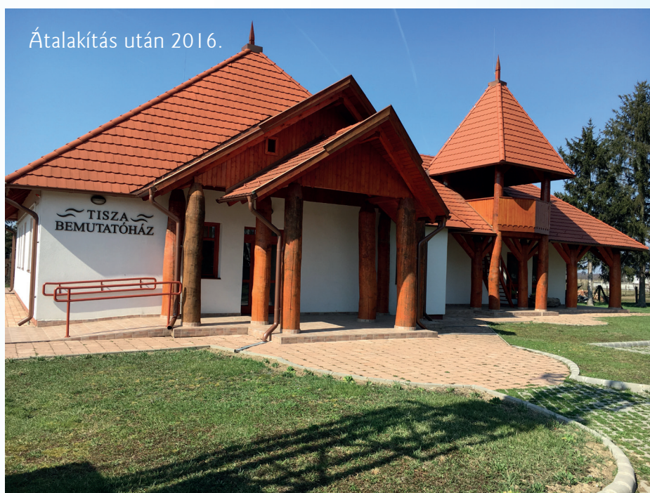
Átalakítás után 2016.