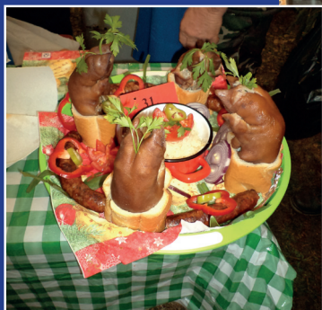
A Szamoskéri kolbászolón