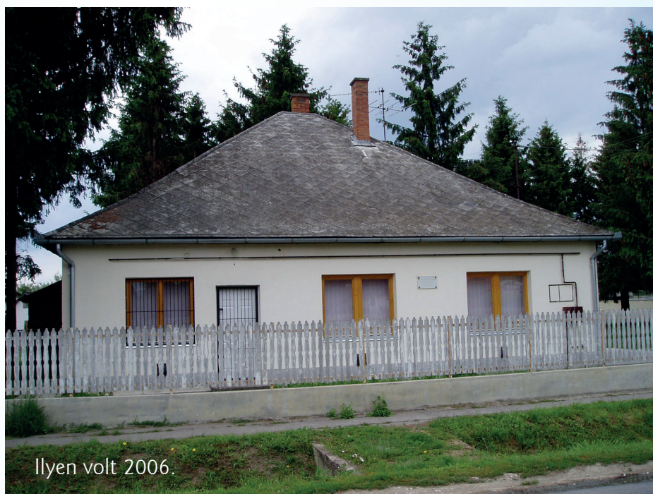
Ilyen volt 2006.

A Tisza bemutató házba belépve először egy helytörténeti fotókiállítás fogadja a látogatót. Itt Tivadar település elmúlt néhány évtizedébe nyerünk bepillantást. Beljebb haladva két kiállító tér várja a látogatókat, melyekben a Tisza élővilága kerül bemutatásra diorámák, fotók és filmek segítségével. Az élsarkokban megtekinthetjük a gyurgyalag és a partifecske, mint a Tisza két legjellemzőbb madarának élőhelyét. Beleeshetünk a partifecske partfalakba ázott fészkebe is. Természetesen részletesen bemutatásra került a tiszavirág és különleges életciklusa is. A Felső-Tiszára jellemző halfajokat egy másik tárló mutatja be, visszaemlékezve a tiszai cyanid katasztrófára. Szatmár-Bereg madárvilágával audiovizuális (képek és hangok) eszközök segítségével ismerkedhet meg a látogató. Néhány, a folyó medréből előkerült ősmaradvány is a kiállítás érdekességeinek része.