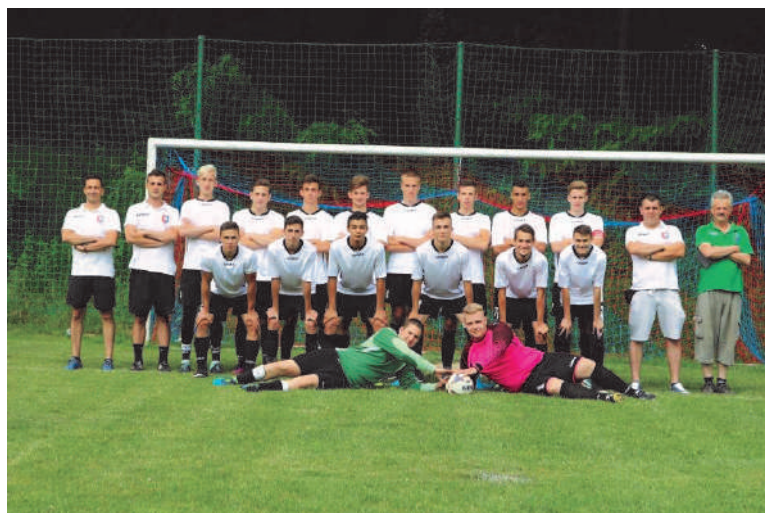
Csetény SE U19 ezüstérmes csapata