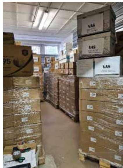
Védőeszközök átadás előtt

A Philip Morris Magyarország Kft. és a Magyar Egészségügyi Szakdolgozói Kamara Országos Szervezete 240 db prémium kategóriás (Huawei MATE-PAD T8) táblagépet adományozott a korábbi tabletpályázatra érvényes pályázatot benyújtó azon tagok részére, akik gyermeküket egyedül nevelik, illetve akiknél a család egy főre jutó jövedelme alacsony. A korábbi érvényes pályázatot benyújtó 840 kolléga közül ezen adománnyal további 240 tagunknak tudunk táblagépet adományozni (1. táblázat). A táblagépek a MESZK Területi Szervezetein keresztül kerültek átadásra.