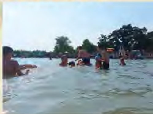
NYÁRI TÁBORBESZÁMOLÓK 14-15. OLDAL