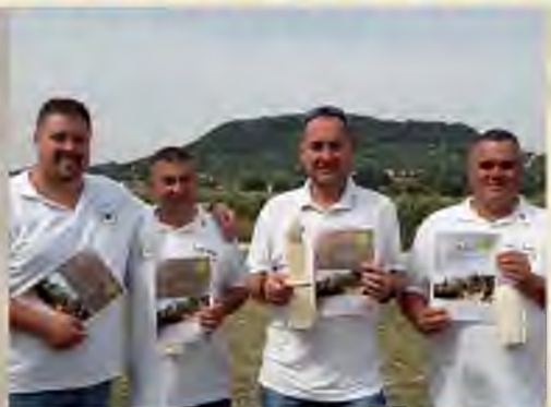
AZ ÓCSA ÖREGHEGYI PINCESOR EGYESÜLET A SOMLÓI BORNAPOKON 8-9. OLDAL