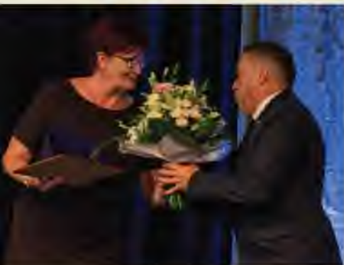
ÁTADÁSRA KERÜLT A PRO URBE ÓCSA KITŰNTETŐ DÍJ 7. OLDAL

ÓCSA VÁROS ÖNKORMÁNYZATÁNAK INGYENES LAPJA