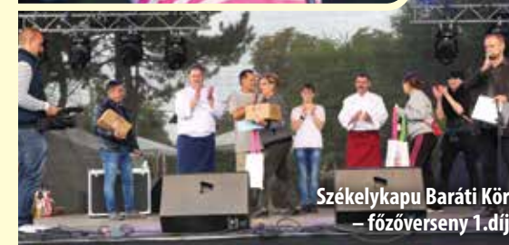
Székelykapu Baráti Kör – főzőverseny 1. díj