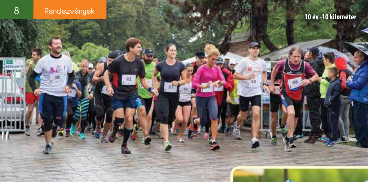
10 év - 10 kilométer