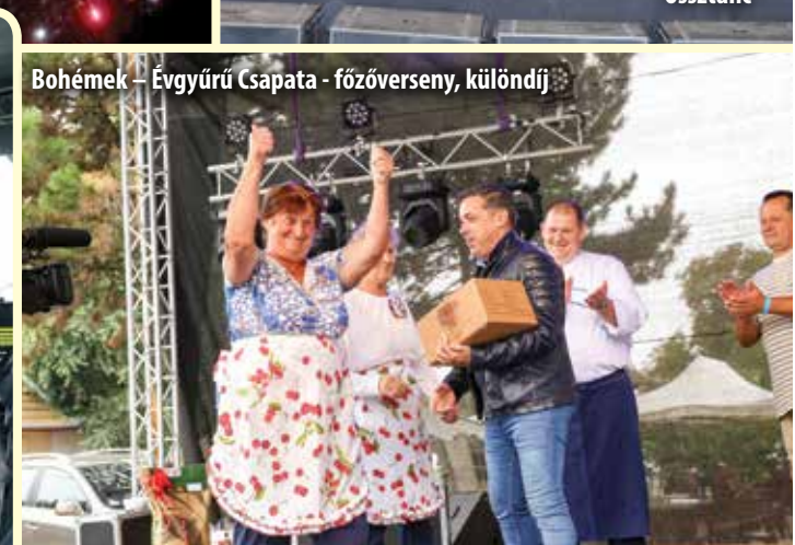
Bohémek – Évgyűri Csapata - főzőverseny, különdíj