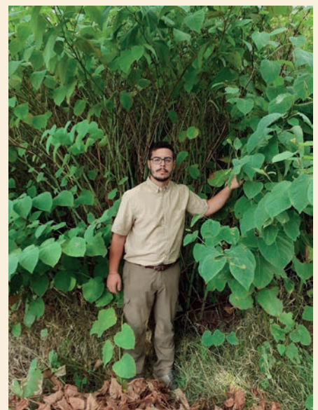
A japánkeserűfű állománya a Ságvári Endre utcában.