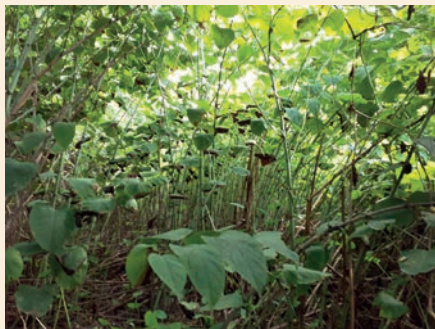
A növény által uralt terület. (Saját kép)

A Selye János Egyetem biológia szakos tanár hallgatójaként a szakdolgozatomban, községünk területén kiválasztott négy élőhelytípus flórájával foglalkoztam, a 2020-as vegetációs időszakban. Számos a népi gyógyászatban is ismeretes gyógynövényt határoztam meg, melyeknek a feldolgozását a jövőben tervezem. Ezt követően Tudományos diákköri munkám, szintén a település területén fellelhető növényekre irányította a figyelmemet. Kutatómunkámban egy a Szendi-ér mellett elterülő kaszálórét növényzeti összetételével és ökológiai viszonyaival foglalkozom részletesebben.