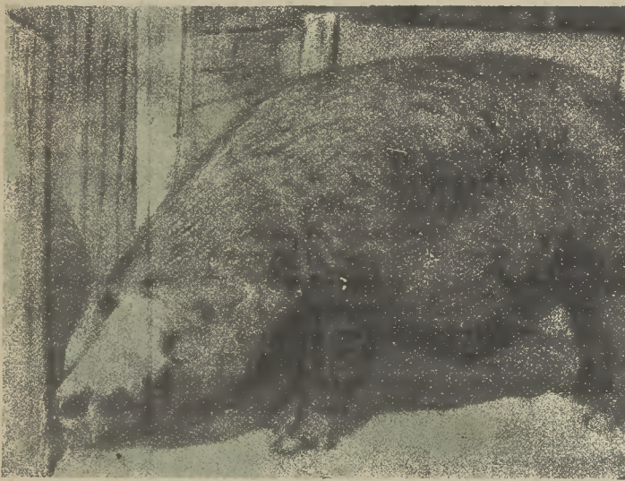
2-ik ábra. Öreg Cornwall tenyészkán az ikervári uradalomban.

Tatay intéző erre nézve ezt közölte: »A fekete szőrözöt elinte a hentesek itt is kifogásolták, »szokás szerint«, mint más fekete színű sertésnél, pedig ezen kifogás nem indokolt, mert a forrázásnál a fekete szőr hagymástól eltávolodik, a bőr pedig olyan hófehér lesz, mint a magyaré.« Most már meg-