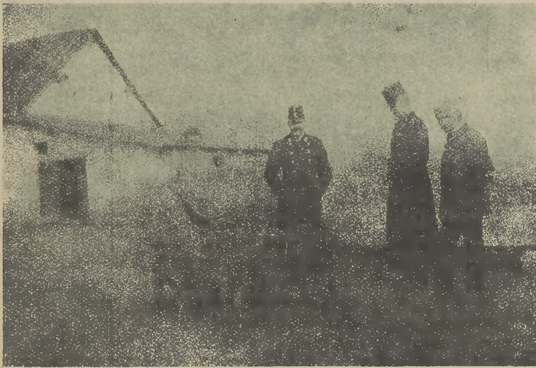
4-ik ábra. Keresztezett (Cornwall apa, mangalicza anya) süldők Vitkay Imre tenyészetében.