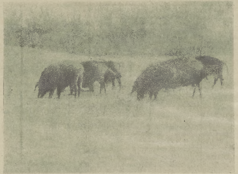
3-ik ábra. Cornwall anyakoczákat tartólegelőn az ikervári uradalomban.