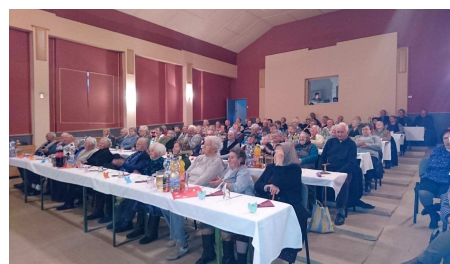
December 4-én volt az Idősek napja a Zalakomári Művelődési Házban.

Községünkben idén is volt lehetőség szociális tűzifa kérelmezésére. 255 fő adott be igénylést, amiből 246-ot tudtunk elfogadni. A kérelem elbírálása a rendelet szerinti 1 főre jutó jövedelem számításán alapult. A háztartásonként járó 1m 3 tűzifa kiosztását már elkezdtük, és folyamatosan végezzük is.