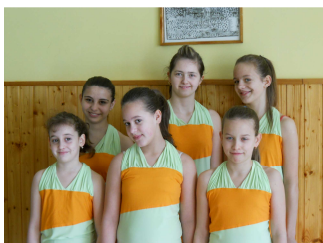
Sorry Művészeti Csoport

A Zalakaros Kistérség Többcélú Társulása idén is megrendezte a Kistérségi Művészeti Fesztivált, melynek 2011-ben a Művelődési Ház adott otthont.