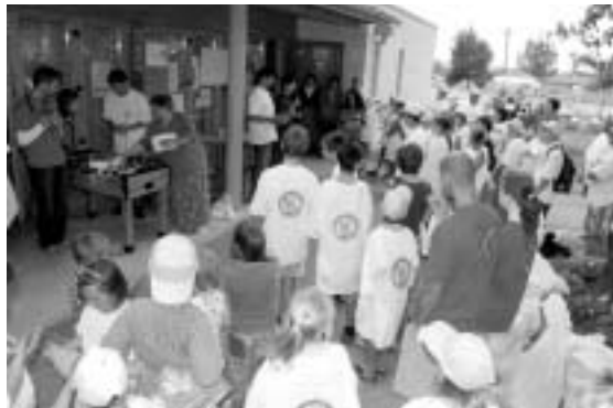
Eredményhirdetés a résztvevő csapatokkal