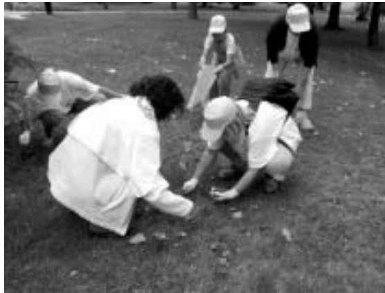
Gyűjtik a parlagfűvet

Herceghalom Önkormányzata és a KlubNext ifjúsági mozgalom közös parlagfű-mentesítési akciót szervezett 2007. június 29-én és 30-án, amelyen több mint 80-an vettek részt. Az akciót azzal a céllal rendezték meg, hogy a Pest Megyei Önkormányzat által kiírt versenyen indulhassunk a „Parlagfű-mentes Falu” címért, amely augusztus 15-én zárul le. A 2 napos akció alapvető célja a megfelelő időben történő parlagfű-mentesítés jelentőségére való figyelemfelhívás, tájékoztatás, valamint a falu parlagfűvel szennyezett területeinek felderítése és részleges mentesítése volt. A rendezvény pénteki napján gyerekek és felnőttek csapatokban mozgósították szombatra a település lakóit, majd másnap a KlubNext ifjúsági mozgalom tagjaival parlagfű-kommandót és csapatversenyt szerveztek, amely során közösen járták végig a település utcáit, közterületeit, bekukkantva természetesen a kertekbe is. A versenybe 6 csapat nevezett és mindegyikhez csatlakozott 2 fő Klub Next-es parlagfű kommandós is. Különböző tevékenységért lehetett pontot kapni. A lát-