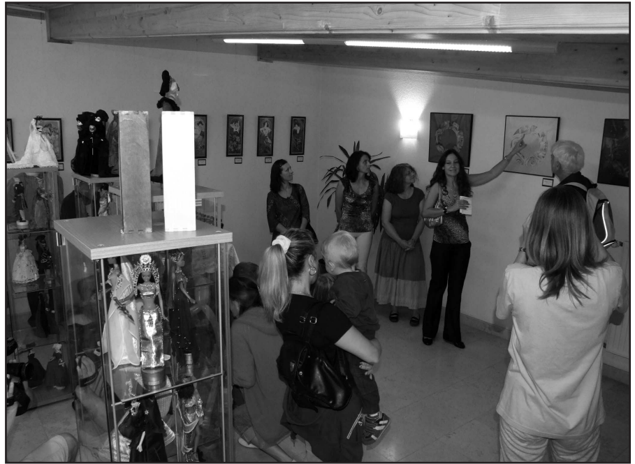
A kiállítás megnyitásán...