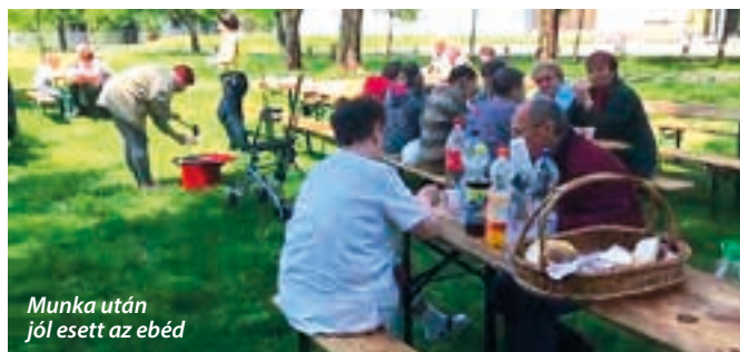
Munka után jól esett az ebéd