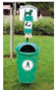
Kutyapiszok gyűjtőedény Tapolcán. Fotózta Sz. Gy.

Az „önkormányzati TV” oldalon lévő hanganyag alapján: Szabó György