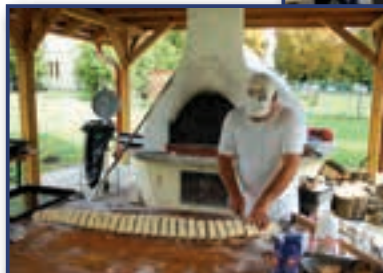
A kemencében készül a kakaós csiga