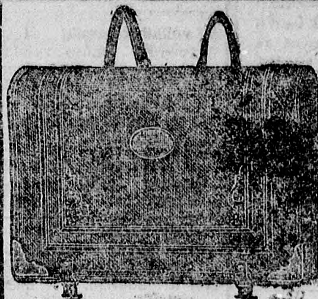
Schlagerböröndősnél Subotica Aleksandrovau. 1.

Közvetít, vesz és elad bel- és külföldi ingó és ingatlan vagyontárgyakat Elvállal mindenféle kereskedelmi, gyári, iparvállalati és részvényfarsasági könyvek vezetését, ellenőrzését, felülvizsgálását, lezárását, leltár és mérlegkészítését Elfogad a biztosítás minden ágazatára kiterjedő biztosításokat Átvesz kereskedelmi, pénzügyi, ipari és egyéb vállalatok képviseletét és ügynevelését Érvényesít bel- és külföldi követeléseket és azoknak perenkívüli vagy peres behajtásától gondoskodik Ad pontos és megbízható információkat a helyi piacra vonatkozólag Foglalkozik a fizetésektelen cégek kiegészítése körül összes munkálatokkal