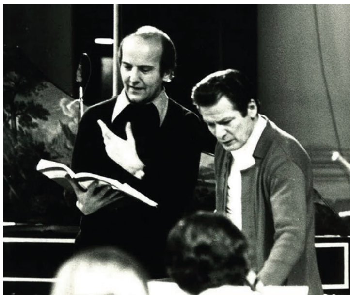
Próba közben Sir Neville Marrinerrel