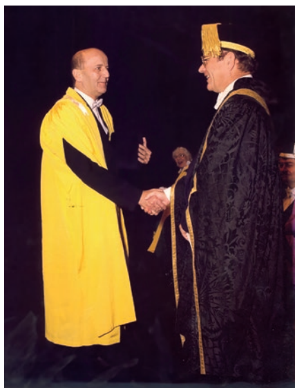
Az oxfordi díszdoktori cím átvételekor