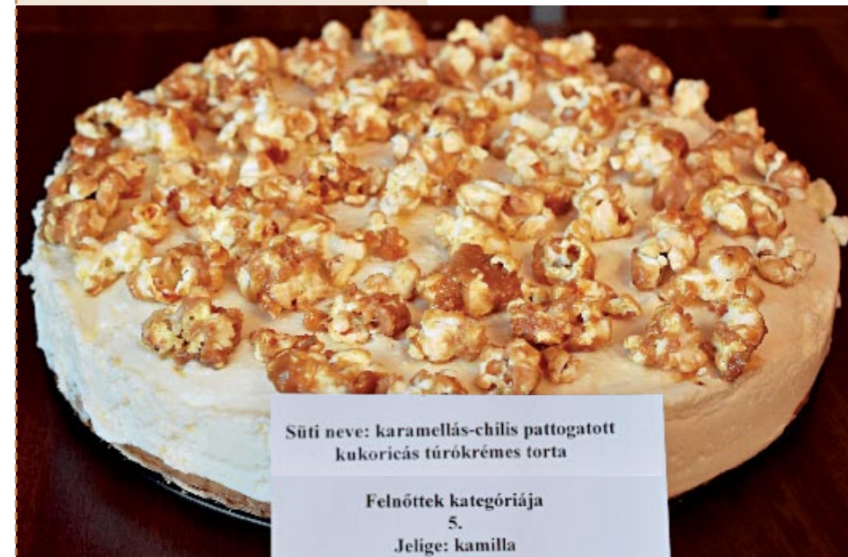
Süti neve: karamellás-chilis pattogatott kukoricás túrókrémes torta

A piskótát szokásos módon elkészítjük, megsütjük. Ha kihűlt, a tortaformából kivesszük. A túró villával krémesítjük, a cukrokat, a joghurtot, a felolvasztott fehér csokoládét és a zselatint belekeverjük. Végül óvatosan beleforgatjuk a felvert tejszínt. A kész masszát a tésztára kenjük. A vajat megolvasztjuk, beleteszük a barnacukrot és karamellizáljuk. Közben a chilit is beleöntjük. Miután kész, az olvasztott karamellbe beleforgatjuk a pattogatott kukoricát. Ezt helyezük a túrókrémre. Egy éjszakát a hűtőben tároljuk, utána szeletelhető.