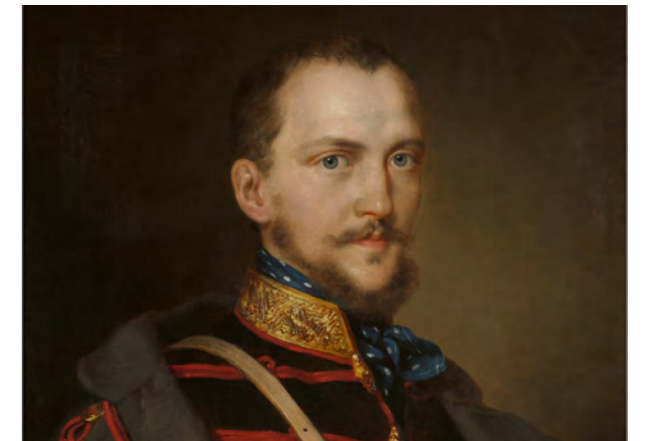
Barabás Miklós: Görgy Artúr, 1850 MNM Történelmi Képcsarnok Festménygyűjtemény sed do eiusmod tempor