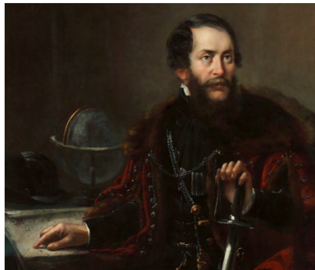
Napoleon Itakowicz: Kossuth Lajos, 1853 MNM Történelmi Képcsarnok Festménygyűjtemény sed do eiusmod tempor

Így érkezünk el 1909 augusztusához. Amikor min- den összeomlott. Kováts ugyanis óvatlan volt. A beépí- tett emberével nem a Nemzeti Múzeumnak ajánlotta fel az 53 darabos, szabadságharcos gyűjteményt, hanemegypestiantikváriumbaküldteafiút. A tulaj- donosnak természetesen tetszett a gyűjtemény, komoly pénzt ajánlott érte, de azzal a kikötéssel, hogy hagyják ott az iratokat, átnézeti egy szakértővel. Kováts Lajos pechére pedig a Nemzeti Múzeumba vitte be az anyagot. Őt viszont, mint a forradalmi téma szakértőjét hiába keresték, hiszen Svájcba ment szabadságra a feleségével.