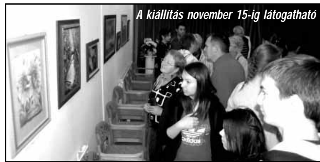
A kiállítás november 15-ig látogatható