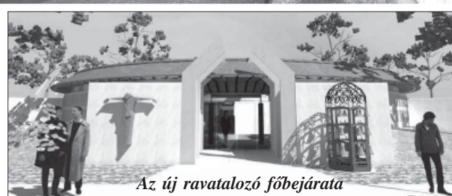
Az új ravatalozó főbejárata