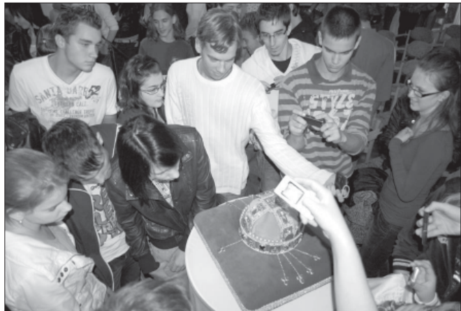
Középiskolánk diákjai nézik és fotózzák a Szent Koronát