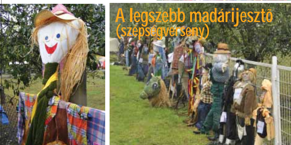
A legszebb madárijesztő (szépségverseny)