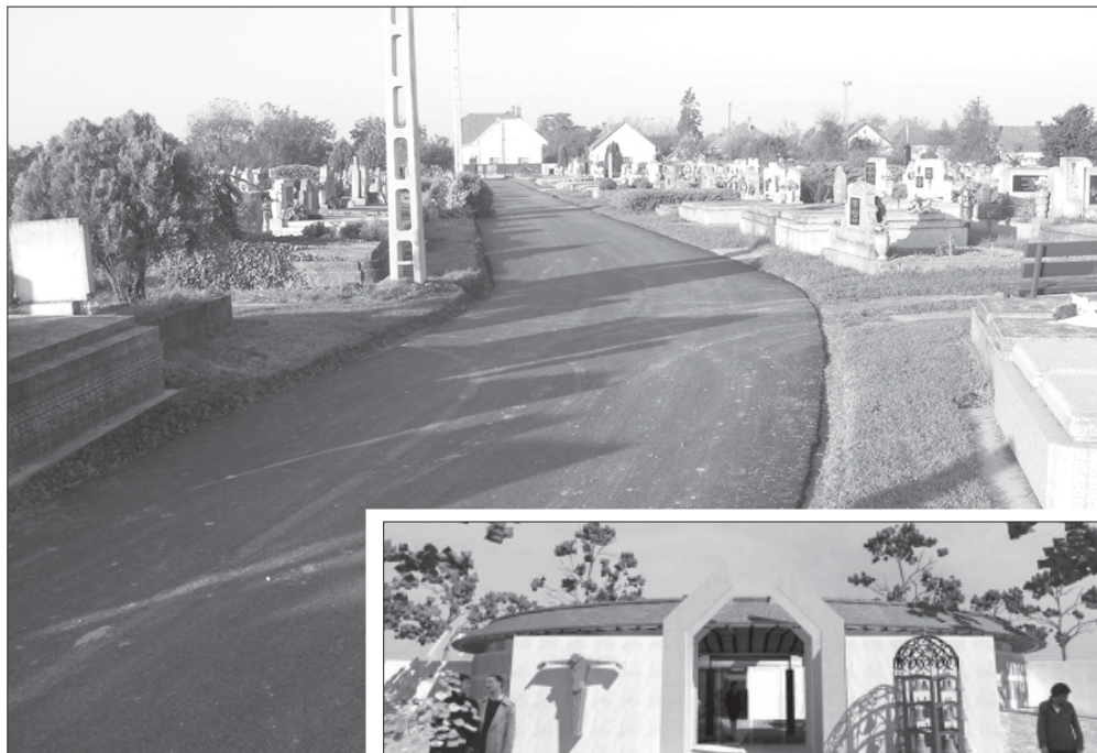
Az új ravatalozóhoz teljesen új út is épült