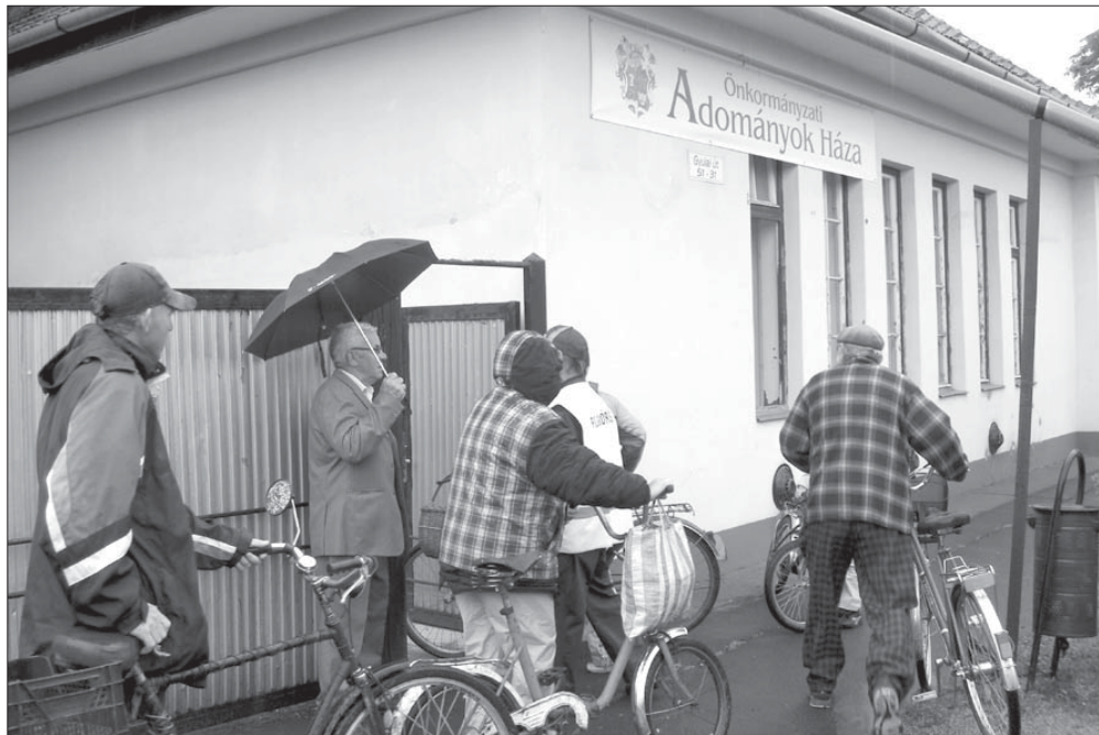
Az Önkormányzati Adományok Háza a jelzett időszakban 9 és 15.00 óra között tart nyitva a