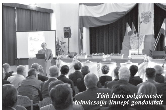
Tóth Imre polgármester tolmácsolja ünnepi gondolatait

2010. októbere jeles időpontja a magyar önkormányzatiságnak, ugyanis kerek húsz esztendővel ezelőtt, az 1990-es rendszerváltást követően alakultak meg a magyar települések önkormányzatai. Tehát húsz esztendeje mind a 3200 magyarországi település - köztük Sarkad városa is - a saját sorsának kovácsa, helyi szinten hozhatja meg fontos döntéseit, illetve dönthet sorsáról, kormányozhatja önmagát, mint 3200 „kis köztársaság”! S ez a 3200 „kis köztársaság” az önkormányzatiság kezdetével, immáron húsz esztendeje saját jelenének letéteményese és jövőjének hordozója. Kossuth Lajos szavaival élve: „Az önkormányzat