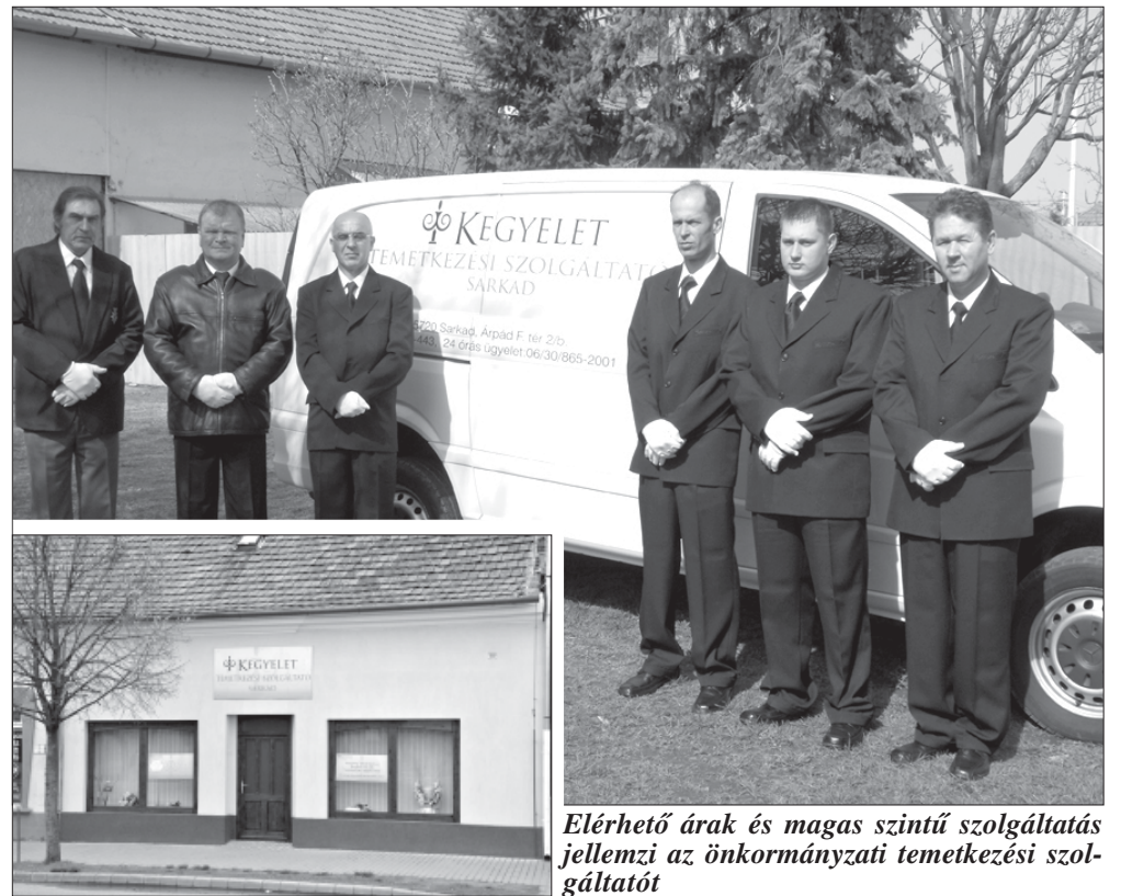
Elérhető árak és magas szintű szolgáltatás jellemzi az önkormányzati temetkezési szolgáltatót