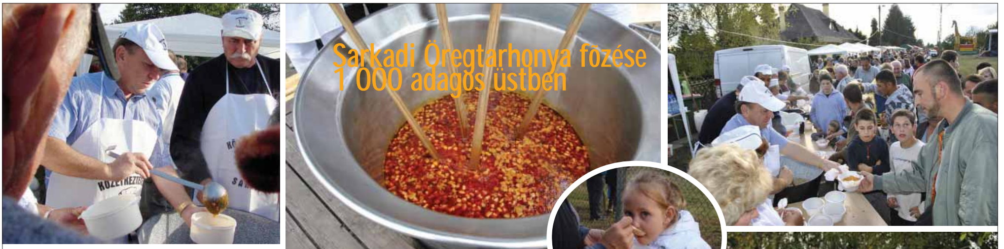
Sarkadi Öregtarhonya főzése 1 000 adagos üstben