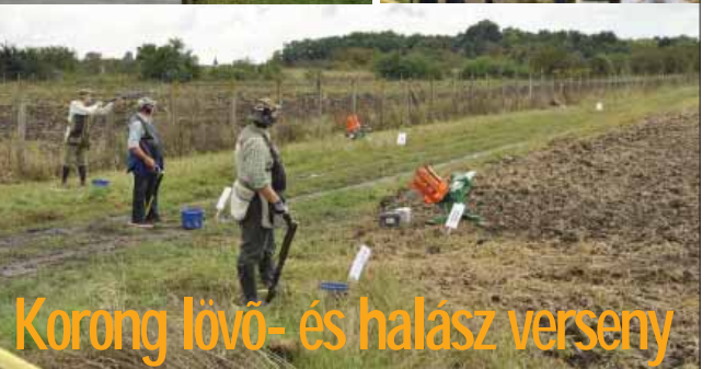
Korong lövő- és halász verseny