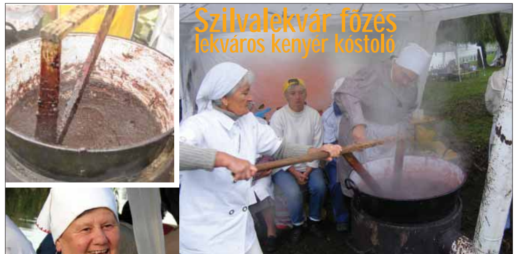
Szilvalekvár főzés lekváros kenyér kostoló