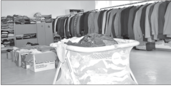
A téltre készülve – összegyűjtésre kerültek a használt, de...

Ezt felismerve Sarkad Város Önkormányzatának Képviselő-testülete elhatározta, hogy a korábban megüresedett önkormányzati tulajdonú épületek egyikében létrehozza az Önkormányzati Adományok Házát , melyben az adományok szervezett gyűjtése, rendszerezése, szétosztása méltó módon történhet a lakosság irányába. Emlékeztet, hogy szorgos