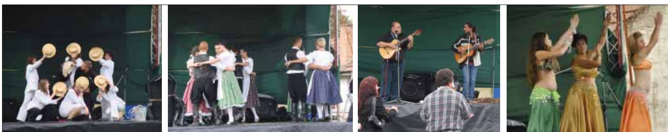
Nagyszínpad, kulturális műsorok