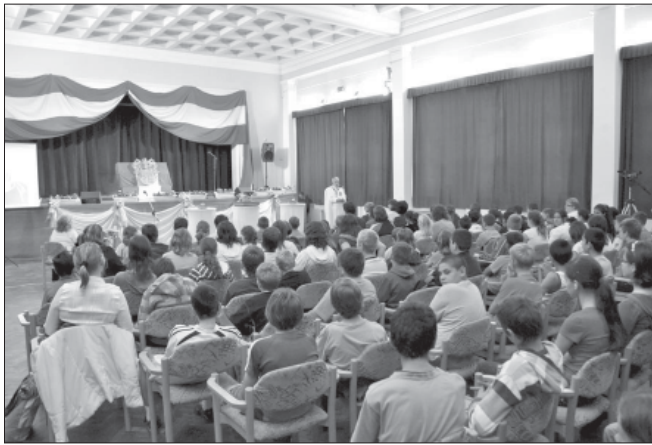
A Szent Koronáról szóló előadást érdeklődve hallgató sarkadi diákok