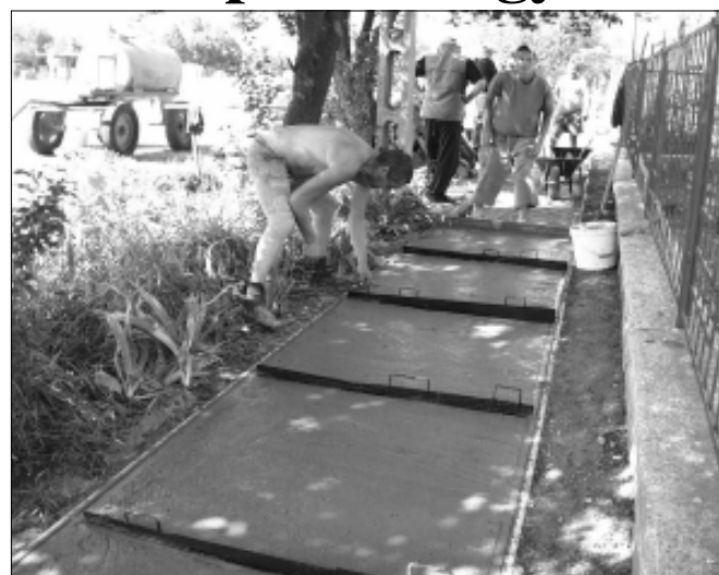
Betonjárda építés a gyulai úton