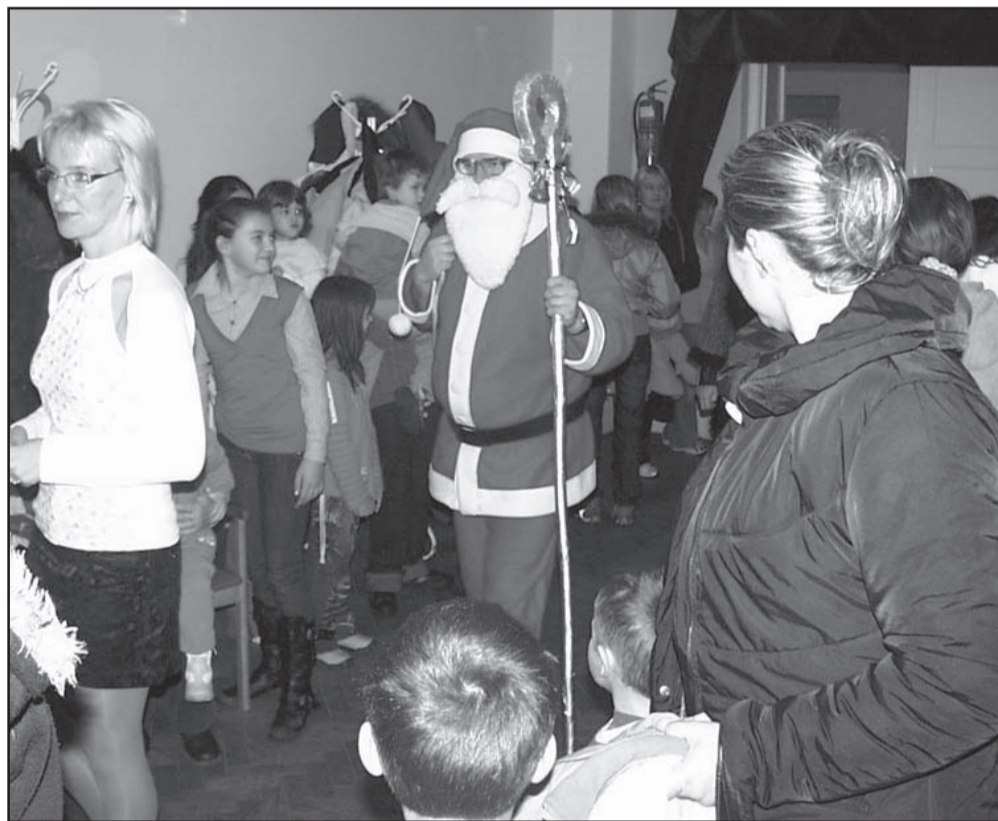
Megérkezett a Télapó

Az elmúlt héten, szombat délelőtt a Bartók Béla Művelődési Központban Sarkad óvodáinak dolgozói „A Télapó itt van” címmel Kistérségi Télapó Ünnepséget szerveztek. Sok szülő, gyermek volt tanúja, ahogy megérkezett a Télapó, akivel aztán együtt élvezték az óvodások köszöntő műsorát, a bábszínház előadását. Mindenki megtalálta a magának megfelelő elfoglaltságot a játszó asztaloknál, ahol karácsonyi fenyődíszeket készíthettek szakavatott óvó nénik irányításával.