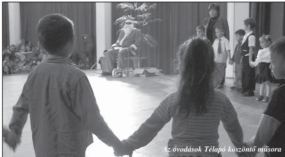
Az óvodások Télapó köszöntő műsora