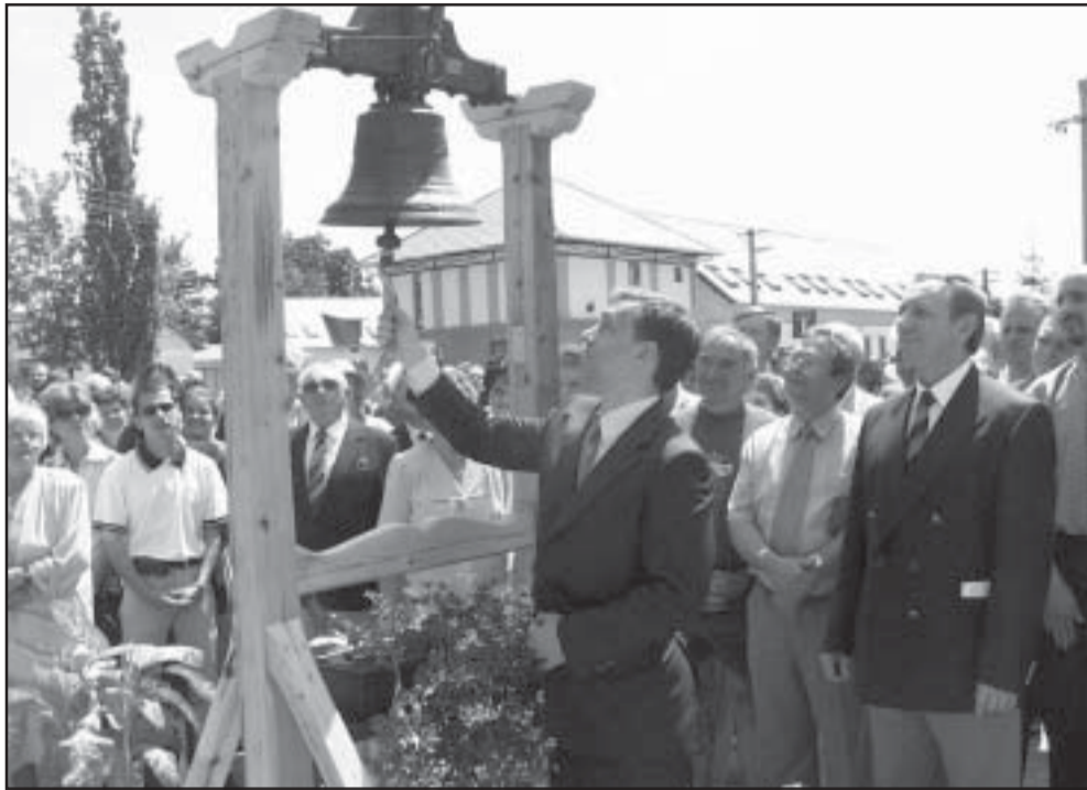
A harangjáték avatása harangszóval