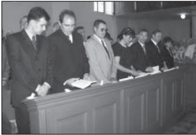
Az istentiszteleten. A város vendége volt ezen a napon dr. Turi Kovács Béla, volt környezetvédelmi miniszter is

először Tóth Imre polgármester, országgyűlési képviselő lépett megköszönve az előző kormány és Orbán Viktor támogatását a ház felépítéséhez, amit a volt miniszter elnök a következő képpen hátrított el: „Bár jól esik minden dicsérő, elismerő szó mégis el kell hártanom a polgármester úr dicsérő szavait. Ugyanis a polgári kormány tulajdonképpen nem adott semmit sem Önöknek, ha valamit küldött, akkor azt visszaküldte. Tisztelt sarkadiak! Az államnak, a kormánynak soha nincsen pénze. Pénze meg munkája Önöknek van, amiből még adót is fizetnek. Ezt gyűjti be az állam és ezt küldi vissza. Szeretném, ha úgy éreznék, nem az volt a rendkívüli ami abban a négy évben történt, hanem az volt a rendellenes, ami az elmúlt egy esztendő-