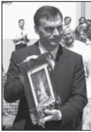
Az egyház ajándéka a templom festett képe

ben történt. Ugyanis Sarkad minden polgára éppen olyan elismerésre, éppen olyan támogatásra érdemes ember, mint például Budapest bármelyik polgára, beleértve az V. kerületi belvárost is.” Az avató szalag átvágása után a ház bejárása közben Orbán