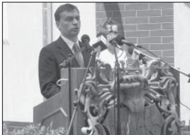
„El kell hártanom a polgármester úr dicsérő szavait”