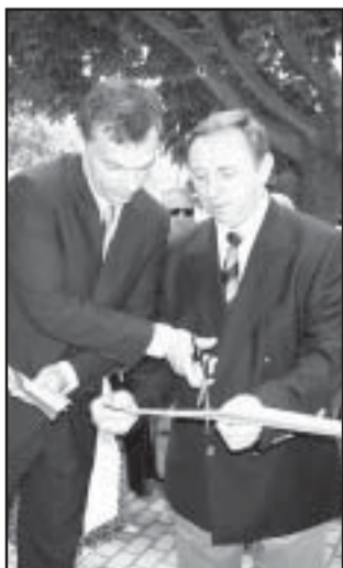
A szalag átvágása