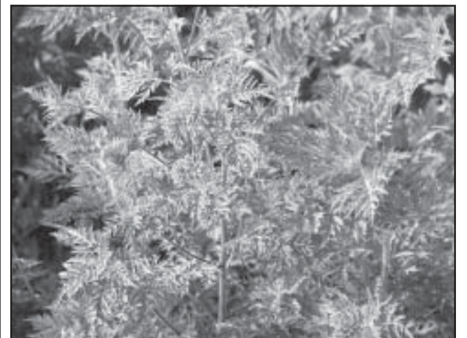
Egy-egy kifejlett növény átlagosan 8 milliárd pollent termel