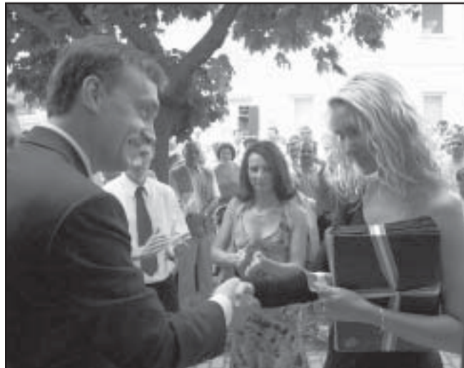
Orbán Viktor az egyik bérlőnek gratulál