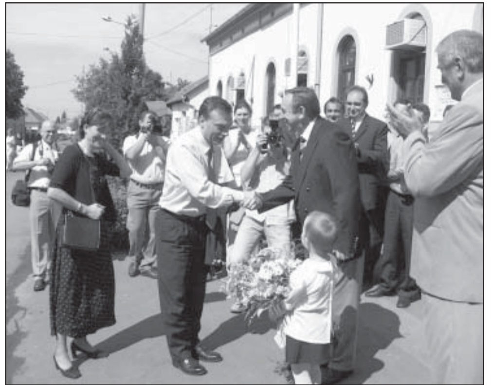
Orbán Viktort Tóth Imre polgármester köszönti a Városháza előtt

Július 6-án délelőtt – ahogy azt az előző lapszámunk meghívójában is olvashatták – városunkba látogatott dr. Orbán Viktor, Magyarország volt miniszterelnöke. A Belvárosi Református Templom rekonstrukciós munkáinak befejezéseként elkészült új zenélő toronyóra és az egy éven belül felépült 26 lakásos „Fecskeház” átadására érkezett Sarkadra. A város jegyzője köszöntötte (a város táblánál) amint Sarkád területére ért gépkocsija, majd a Városháza előtt fogadta Tóth Imre polgármester munkatársaival, illetve a képviselő testület tagjaival a felesége kíséretében érkező politikust.