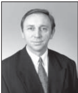
Tóth Imre polgármester, országgyűlési képviselő