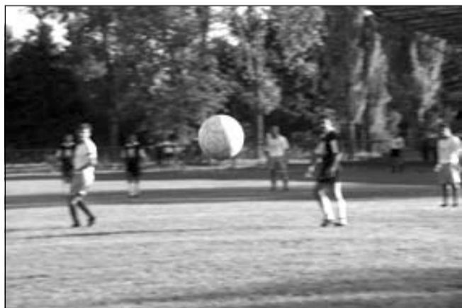
Vasárnap kezdődik a 2001. évi megyei I.o. focibajnokság

Az egyesület vezetősége hívja és várja az érdeklődő szurkolókat a mérkőzésekre!