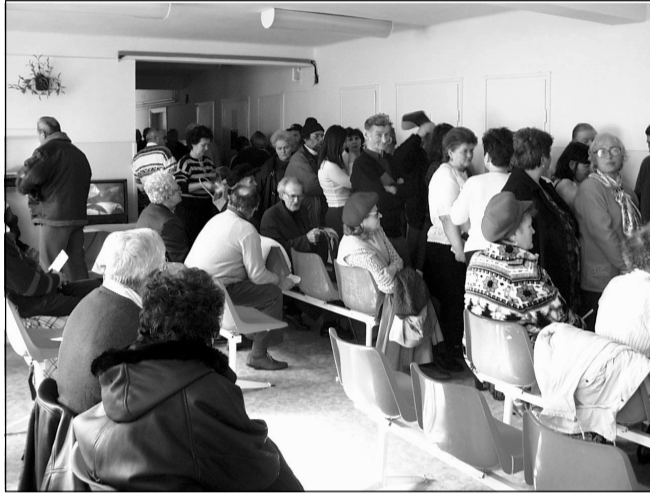
Közel kétszázötvenen jelentek meg az orvosi rendelőben