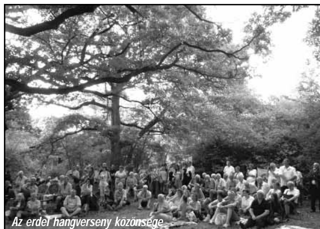
Az erdei hangverseny közönsége

A programok összművészeti jellegére jellemzően kiemelkedő képzőművésze-