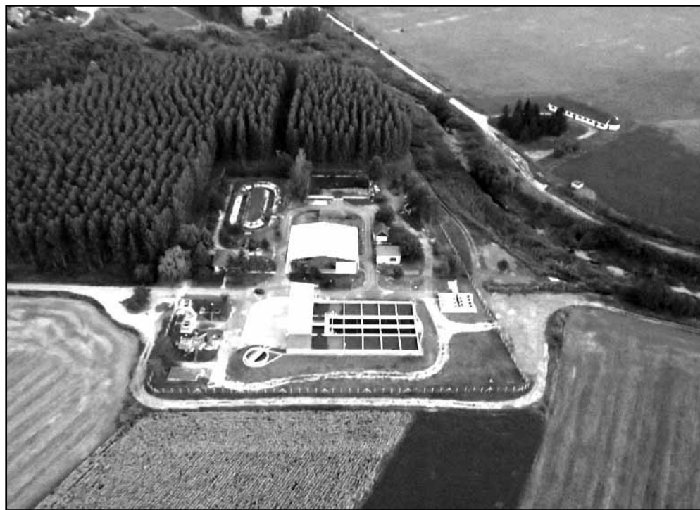
A város új szennyvíztisztító telepének lát képe a magasból

A sikeresen megvalósított projektnak köszönhetően teljesen újjáépült a város határában lévő szennyvíztelep, ami egyrészt a korábbihoz képest megduplázott kapacitással bírja a teljes település szennyvizének kezelését, másrészt a legmodernebb