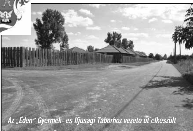
Az „Eden” Gyermekek- és Ifjúsági Táborhoz vezető út elkészült