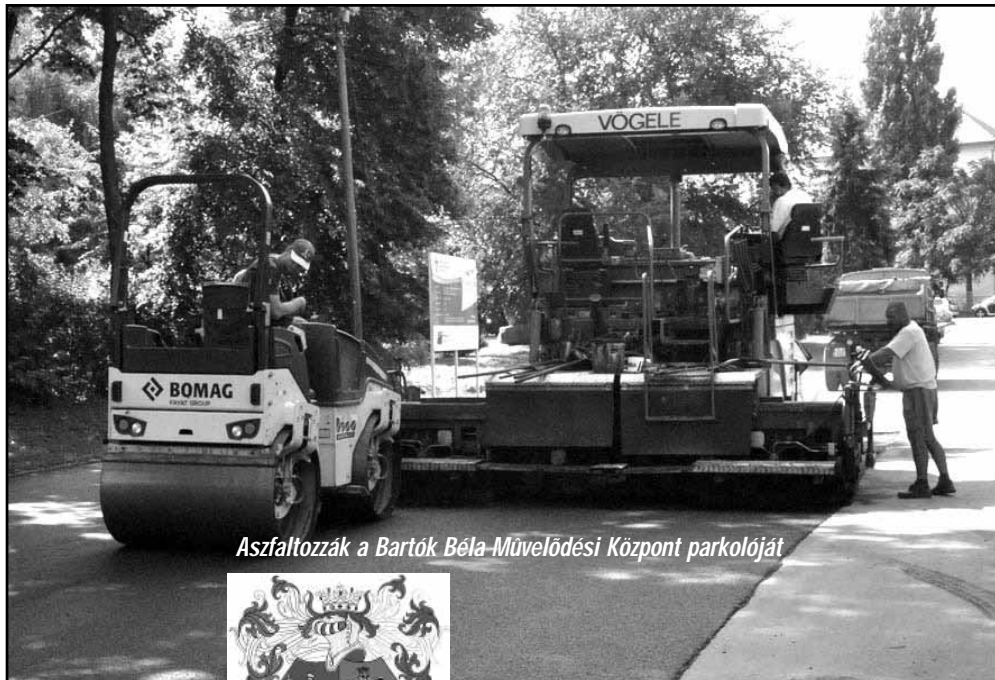
Aszfaltolozzák a Bartók Béla-Művelődési Központ parkolóját