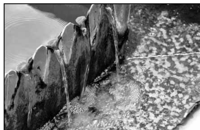
A városból érkező szennyezett víz a medencéken átömlesztve tisztábbá válik a természeti környezetünkben található vizek többségénél