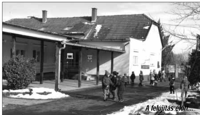
A felújítás előtt...