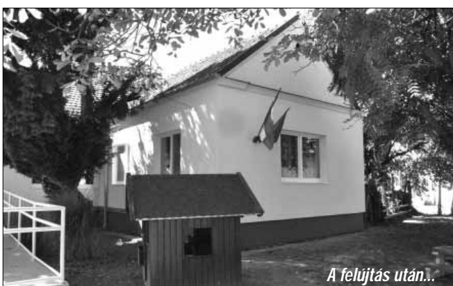
A felújítás után...