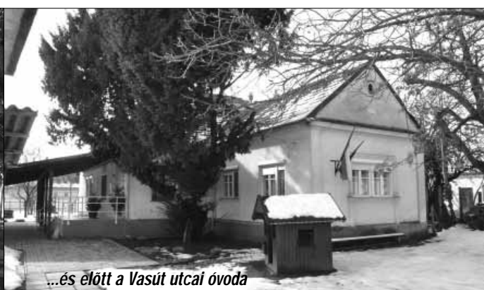
...és előtt a Vasút utcai óvoda