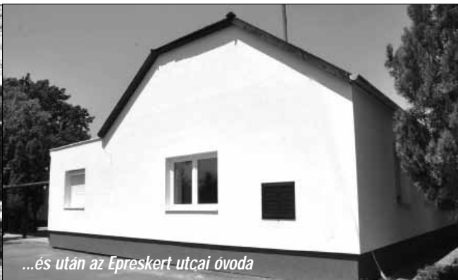
...és után az Epreskert utcai óvoda