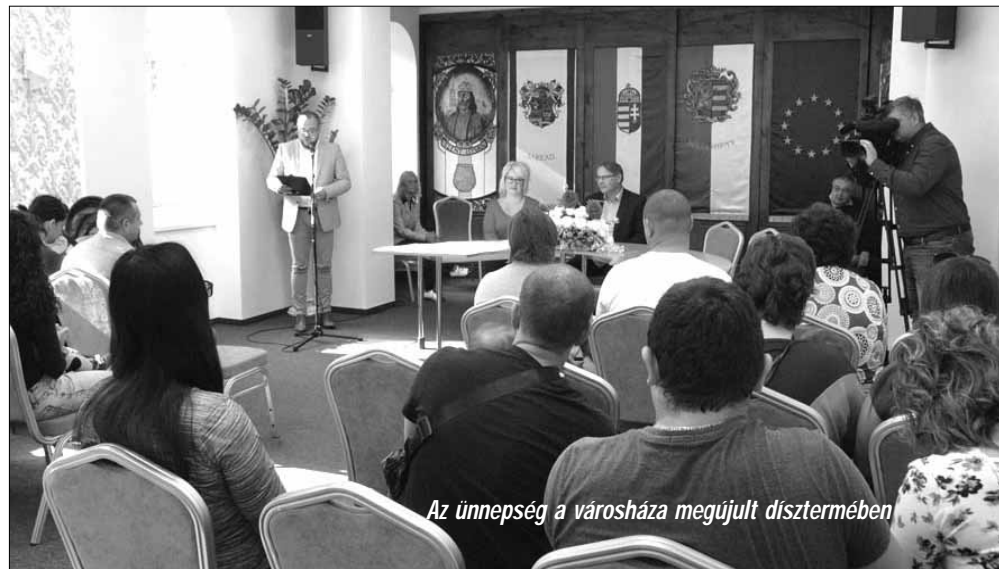
Az ünnepség a városháza megújult dísztermében