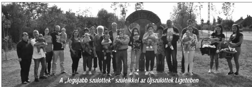
A „Jegűjabb szülöttek” szüleikkel az Újszülöttek Ligetében